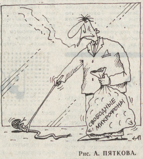
Рис. А. ПЯТКОВА.

Опять возвращаемся к теме о злоупотреблении служебным положением при распределении квартир. В прошедшем и начавшемся годах мы опубликовали несколько материалов на эту тему. Отклики читателей самые разные. Начиная от того, что «этого не может быть, потому что не может быть» и кончая угрозами и оскорблениями в адрес «номенклатурных работ». Поэтому остановимся на некоторых из них.