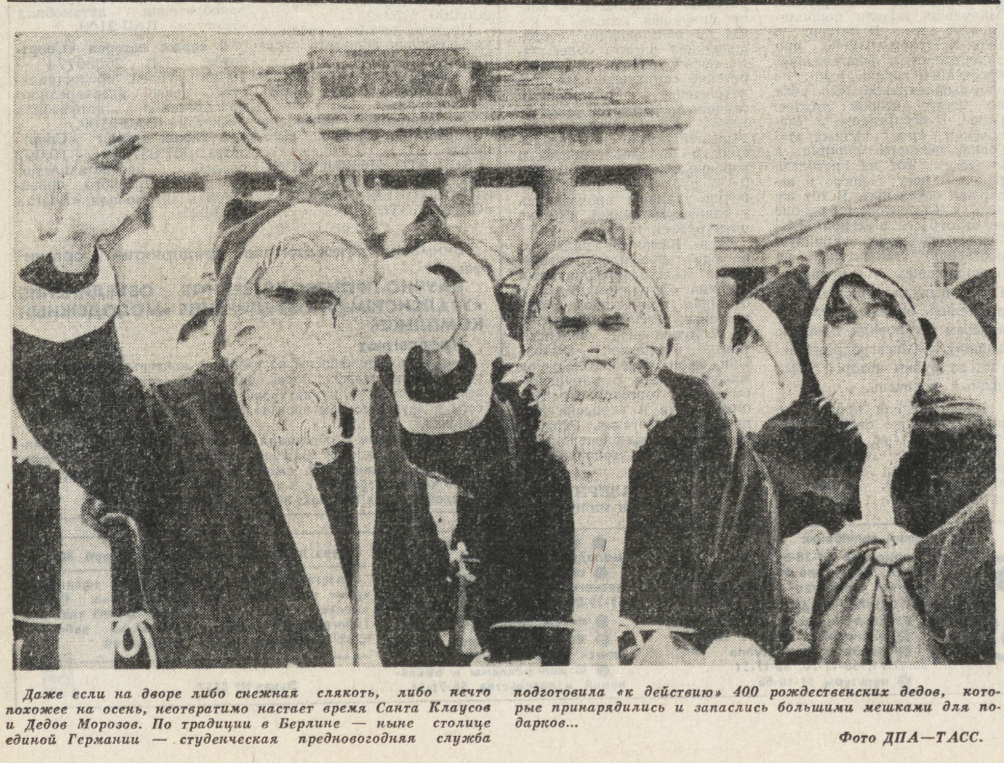
Даже если на дворе либо снежная слякоть, либо нечто похожее на осень, неотвратимо наступает время Санта Клауса и Дедов Морозов. По традиции в Берлине — ныне столице единой Германии — студенческая предновогодняя служба

С Вячеславом Малежником я встретился в Москве. Мне повезло: застать его сложно. — Летом и осенью у вас было много гастролей?