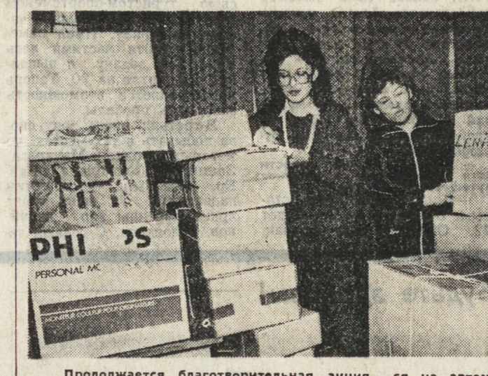
Продолжается благотворительная акция «Посылка для Ленинграда». Уже третье судно прибыло в город на Неве из Гамбурга. Опирается рейс самолета с продуктами питания, многие немецкие фирмы собираются на автомобилях привезти аналогичные грузы.