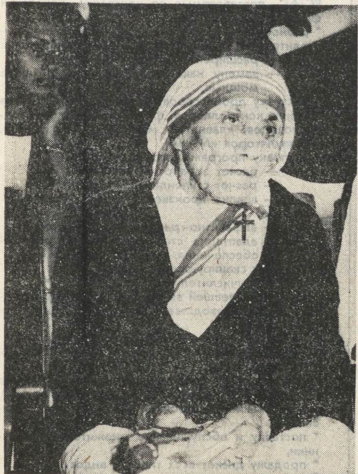
Имя матери Терезы, основательницы и верховной настоятельницы монашеского Ордена милосердия, стало во всем мире символом добра и сострадания. Вся жизнь этой хрупкой женщины — подлинничество во имя любви и помощи ближнему.