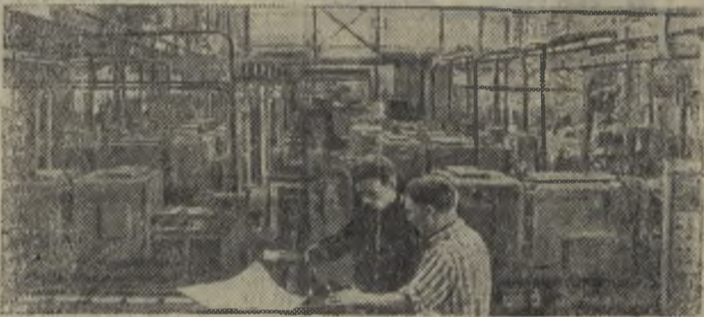
Московский станкостроительный завод имени Серго Орджоникидзе досрочно закончил сборку одной из крупнейших автоматических линий из числа выпущенных в этом году — «ИЛ-204». В нее входят 36 фрезерных, сверлильных, резьбопарезных и других станков. Ее производительность — 140.000 изделий в год.