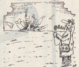
Рис. А. ПЯТКОВА.