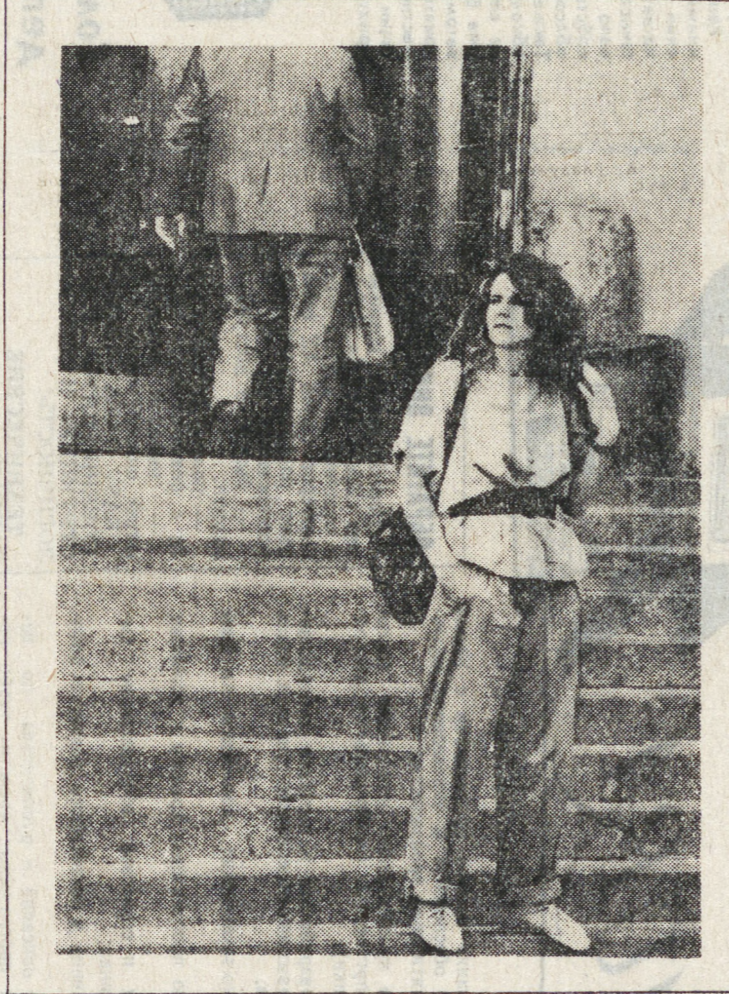
Семья и общество