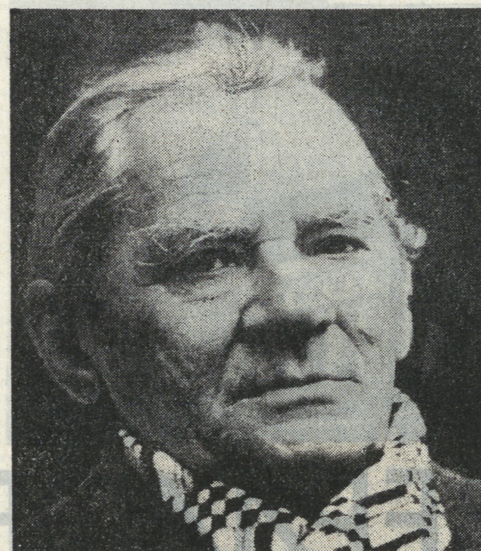
Борис Алексеевич Чичибабин

не называют, но ее можно вывести из стихов — 9 января, поскольку у него есть два стихотворения с этой датой. Чичибабин — фамилия матери. Замечательный химик Чичибабин — его двоюродный дед, но поэт его никогда не видел, как, впрочем, и родного отца. По паспорту Борис Алексеевич носит фамилию усыновившего его отца — Полущин. Отчим был военнослужащим, поэтому семья перекочевала на Украину, пока не осела в Харькове. Русский по крови, поэт был тесно связан с Украиной.