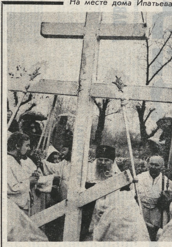
На месте дома Ипатьева

Свердловский городской Совет народных депутатов принял решение о передаче Свердловской епархии земельного участка, на котором находился печально известный дом Ипатьева, место, где расстреляли цари Николая II и членов его семьи. Здесь предполагается построить мемориальную часовню.