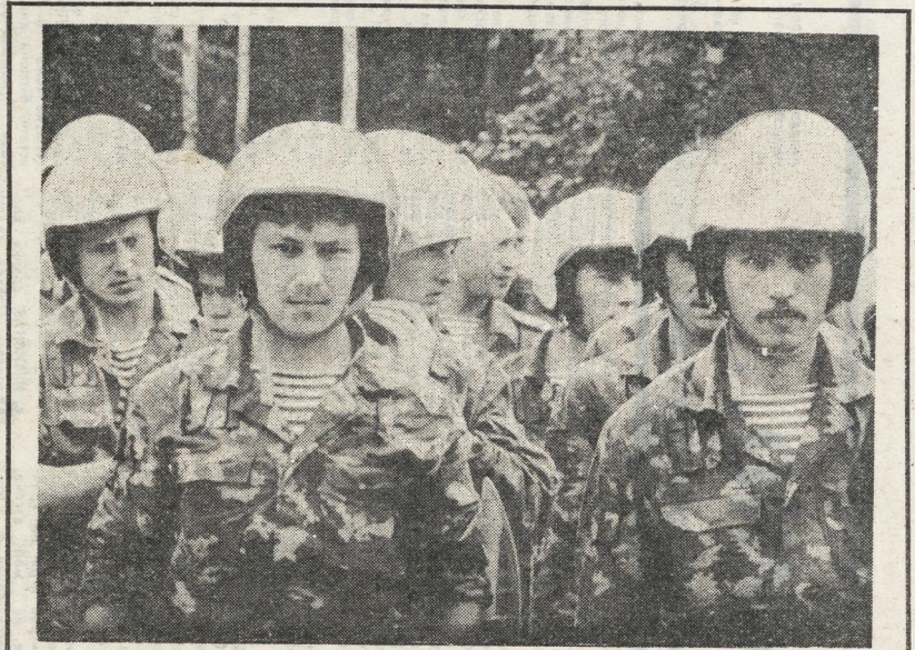
Об этом празднике, наверное, мало кто вспомнил среди простых споров о значении Октября и его роли в истории. Но ведь советская милиция — тоже порождение Октябрьской революции, и не ее работники главным образом виноваты в нынешнем росте преступности. Вчера — в День милиции — обошлось