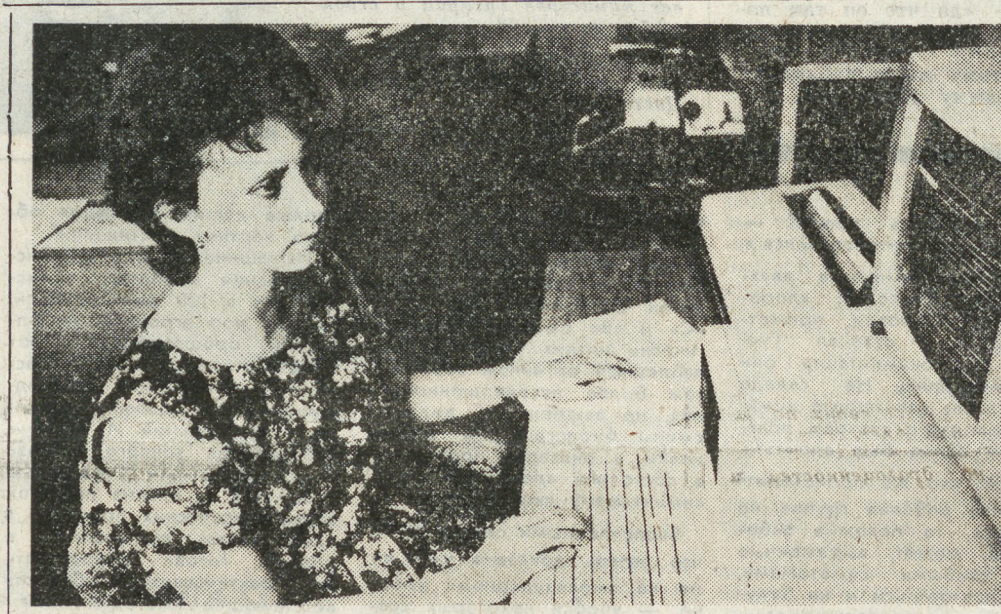
Кто хоть немного знаком с будничной работой солидной инженерной организации, тот хорошо представляет себе вид документов, которые ежедневно и срочно нужно обработать. Труд малоприятный, требующий очень много внимания, сосредоточенности, четкости.