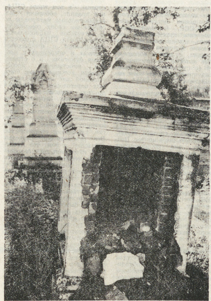
К сожалению, интерес к истории бывает разный. Мог ли чей-то предок поместить о подобном коштунце своих потомков? Любопытство и охота к отеческим гробам... — для Александра Сергеевича Пушкина она сродни любви к Родине. А для нас? НА СНИМКЕ: разрушенные в поисках драгоценностей и икон надгробия.

открытки, пуговицы от мундиров, пряжку ремня, уникальные книги, фотографии генерала Брусиллова и военного министра Куропаткина, военные карты компании 1916 года, макеты танков.