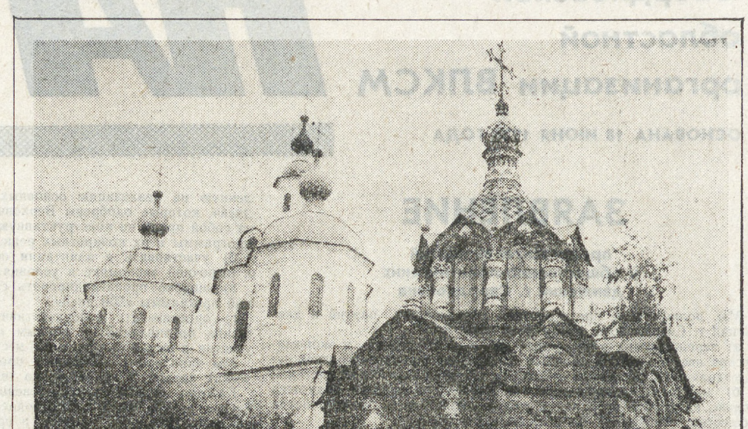
Елабуга: Вчера и сегодня