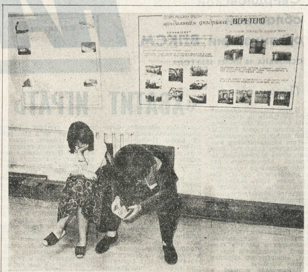
ЛЕНИНГРАД. Депутатская комиссия Ленсовета по промышленности решила создать биржу труда — территориальное учреждение, управляющее работой в рабочих местах. С этой целью в по труду и занятости, представляющие собой государственные районные и межрайонные центры в городе и области. Помимо трудоустройства, по замыслу создателей этой концепции, управление займется анализом рынка занятости, прогнозом масштабов безработицы, организацией подготовки и переподготовки кадров. В составе его предполагается иметь и хозяйственные звенья — центры социально-трудовой реабилитации, малые предприятия с рабочими местами для инвалидов и подростков. Управление по труду и социальным вопросам Леноблгосплана уже сегодня взяло на себя и выполняет часть функций биржи труда. В его структуре действует центр по трудоустройству, переподготовке и профориентации населения, где опытные специалисты, в