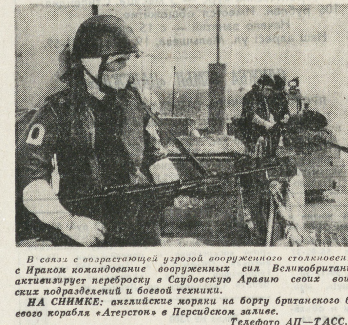
В связи с возрастающей угрозой вооруженным столкновениям в Персидском заливе, Великобритания активизирует переброску в Саудовскую Аравию своих военных подразделений и боевой техники.