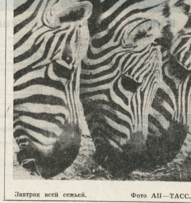
Завтрак всей семьи.