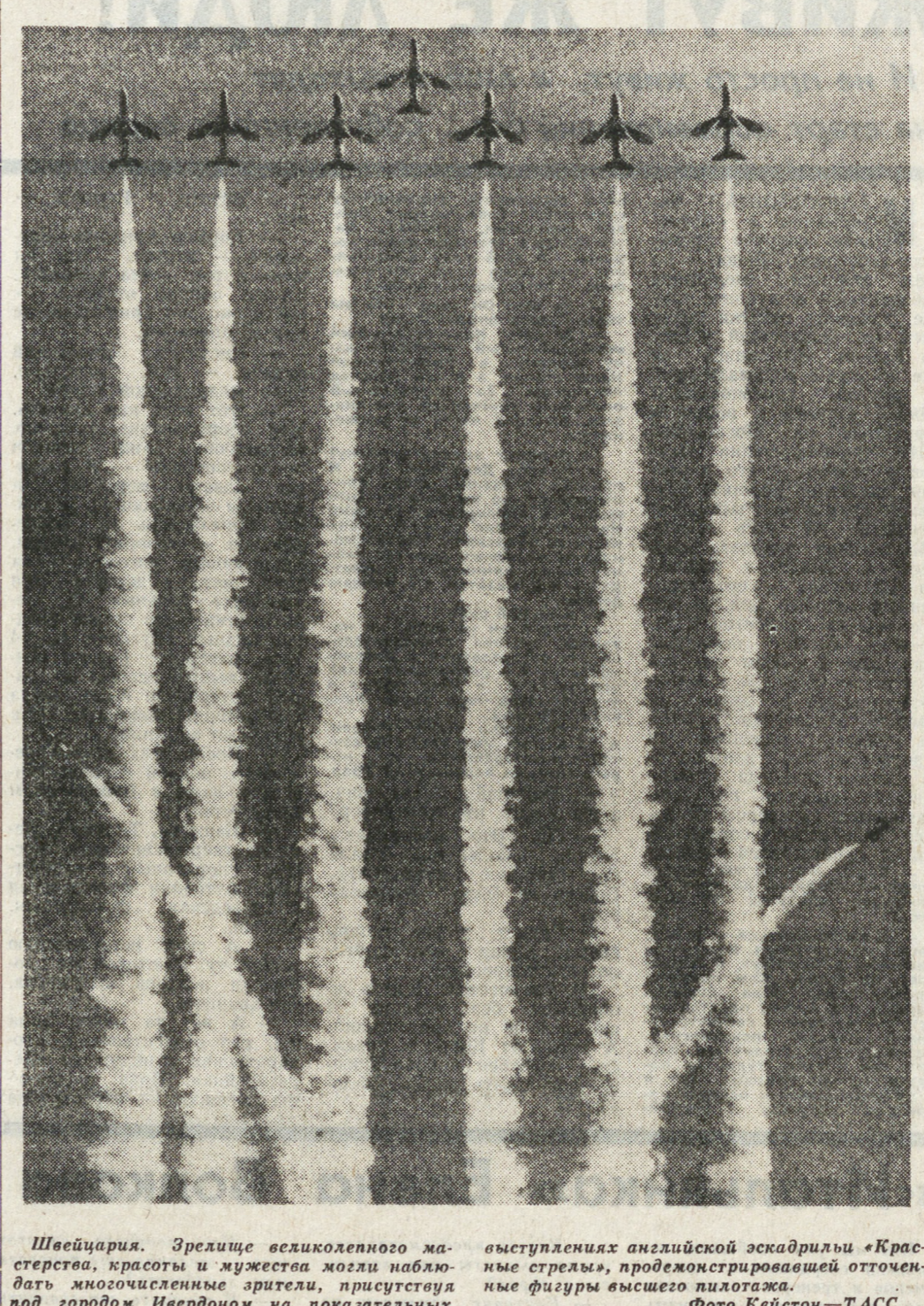
Швейцария. Зрелище всекилометрового марша, красоты и мужества могли наблюдать многочисленные зрители, присутствовавшие под городом Ивердон на показательных выступлениях английской эскадрильи «Красные стрелы»...