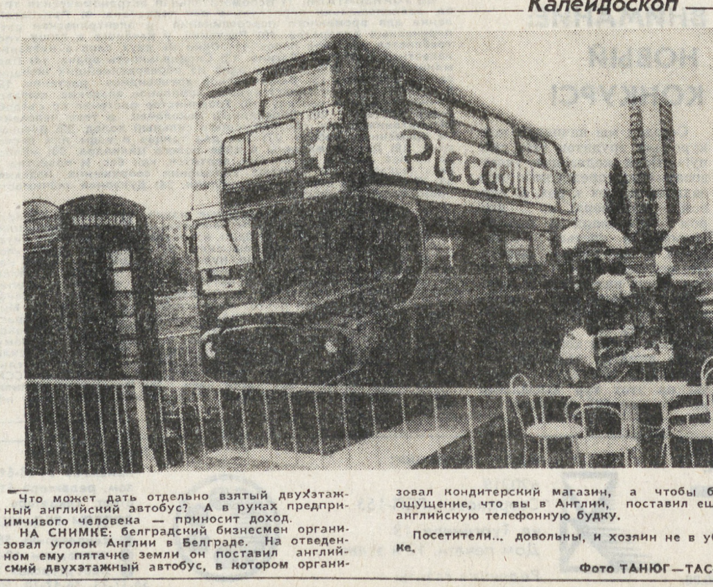
Что может дать отдельно взятый двухэтажный английский автобус? В руках предпринимателя — приносит доход. На отведенном ему участке земли он поставил английский двухэтажный автобус, в котором организовал кондитерский магазин, а чтобы было удобнее, что вы в Англию, поставил еще и английский телефонную будку. Посетители... довольны, и хозяин не в убытке.