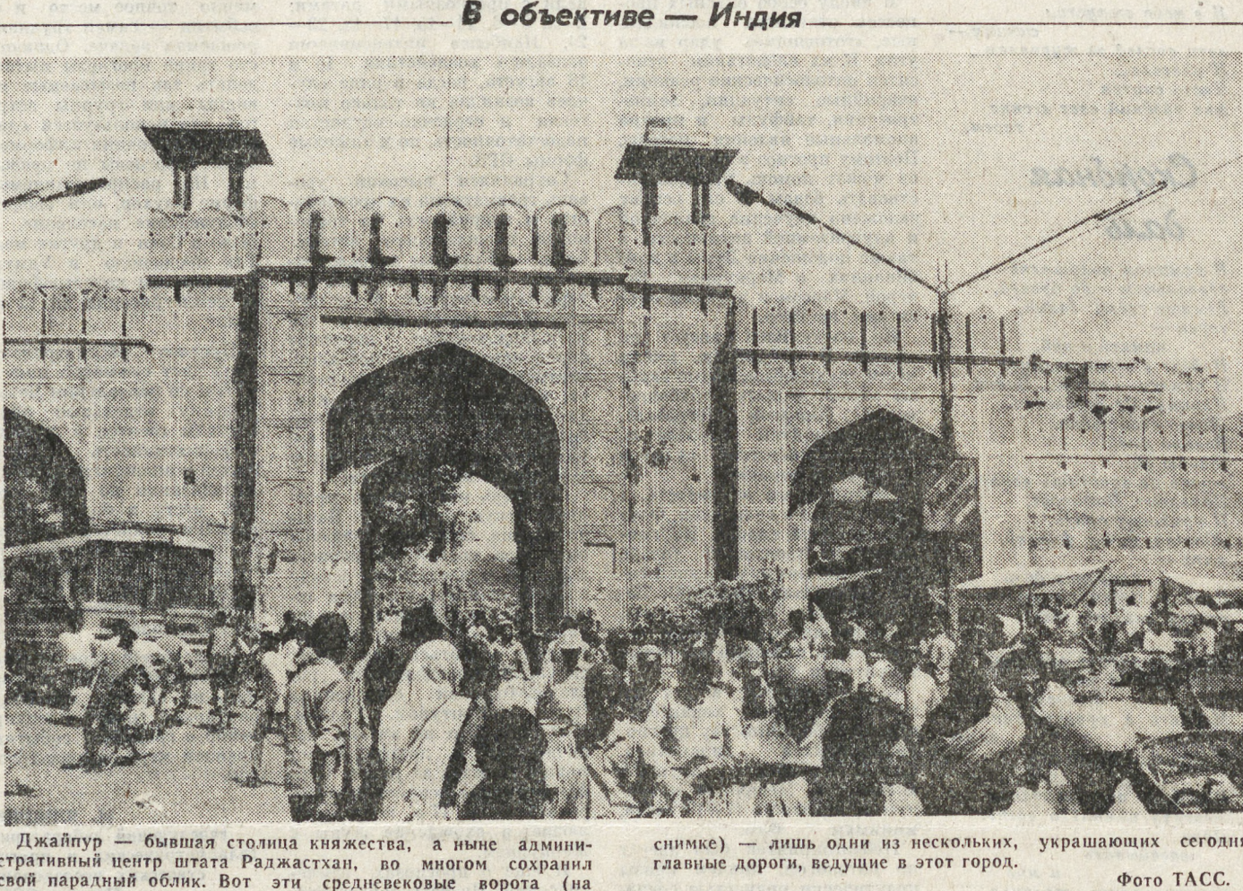
Джайпур — бывшая столица княжества, а ныне административный центр штата Раджастхан, во многом сохранил свой парадный облик. Вот эти средневековые ворота (на снимке) — лишь один из нескольких, украшающих сегодня главные дороги, ведущие в этот город.

Каналы взаимопонимания двух великих культур были многочисленны, австрийцы, осевшие в России, не только сумели проникнуть в сущность русского национального начала, но внесли в него свой элемент. В границах разных эпох они способствовали поступательному развитию отечественной страны, ее гуманизации и прогрессу. Диалог двух этих культур может служить примером больших созидательных возможностей народов, которым узаконительное не заслонило общечеловеческое.