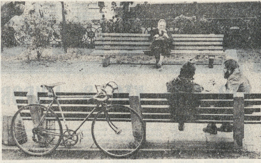
Городские посиделки.

Цена подписки на 1991 год 12 руб. 80 коп. Газета выходит 250 раз в году, ежедневно, кроме воскресенья и понедельника. Печать высокая. Объем 2 п. а. Илраж 185 тыс. экз. Типография «Лява «Уральский рабочий», 620219, Свердловск, пр. Ленина, 49. Заказ № 7036.