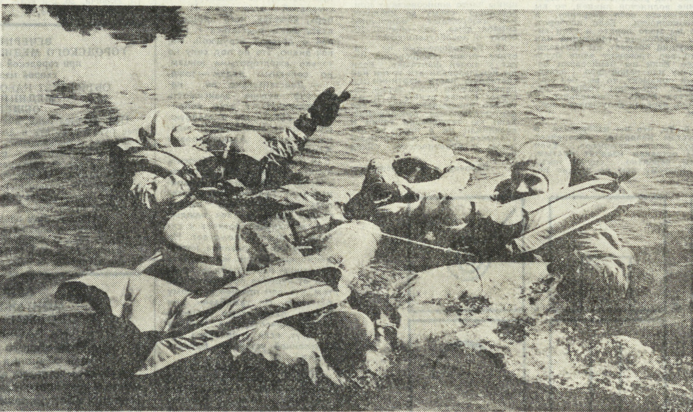
В Центре подготовки космонавтов имени Ю. А. Гагарина продолжается подготовка японских космонавтов Риоко Кикучи и Тойехиро Акияма к совместному советско-японскому полету.