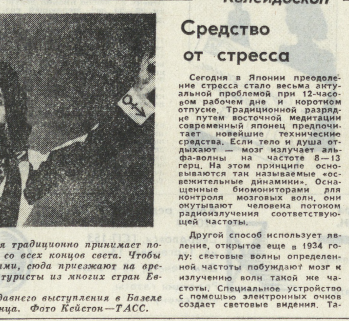
В летний период Швейцария традиционно принимает пограничные асанбли и летучие осы конца сезона. Чтобы отпугнуть многочисленных туристов из многих стран Европы. НА СНИМКЕ: во время небанального выступления в Базеле американской рок-звезды Принца.