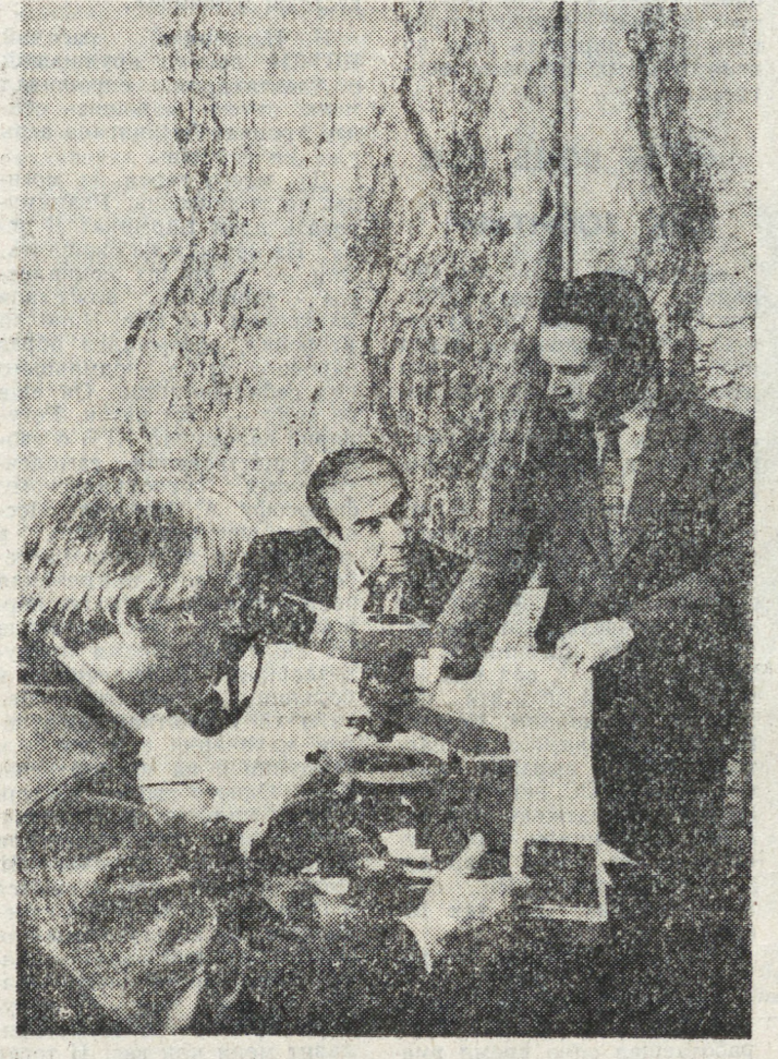
Коллектив производственного объединения «Уралгеология» занимается интенсивным поиском месторождений полезных ископаемых на Урале. За последние время ими открыты крупные месторождения руд черных и цветных металлов. Этому способствует созданная геологами собственная база приборного обеспечения поиска полезных ископаемых.

Российское братство скаутов — именно так хотят назвать свою организацию свердловчане, решившие возродить в России движение бойскаутов. Как сказано в положении о РБС, братство скаутов — светская, внепартийная организация детей и взрослых, объединенных общей платформой — любви к Родине. Цель Российского братства скаутов: на основе системы скаутинга воспитать молодых людей честными, благородными, с сильным характером, физически и нравственно здоровыми, полезными гражданами.