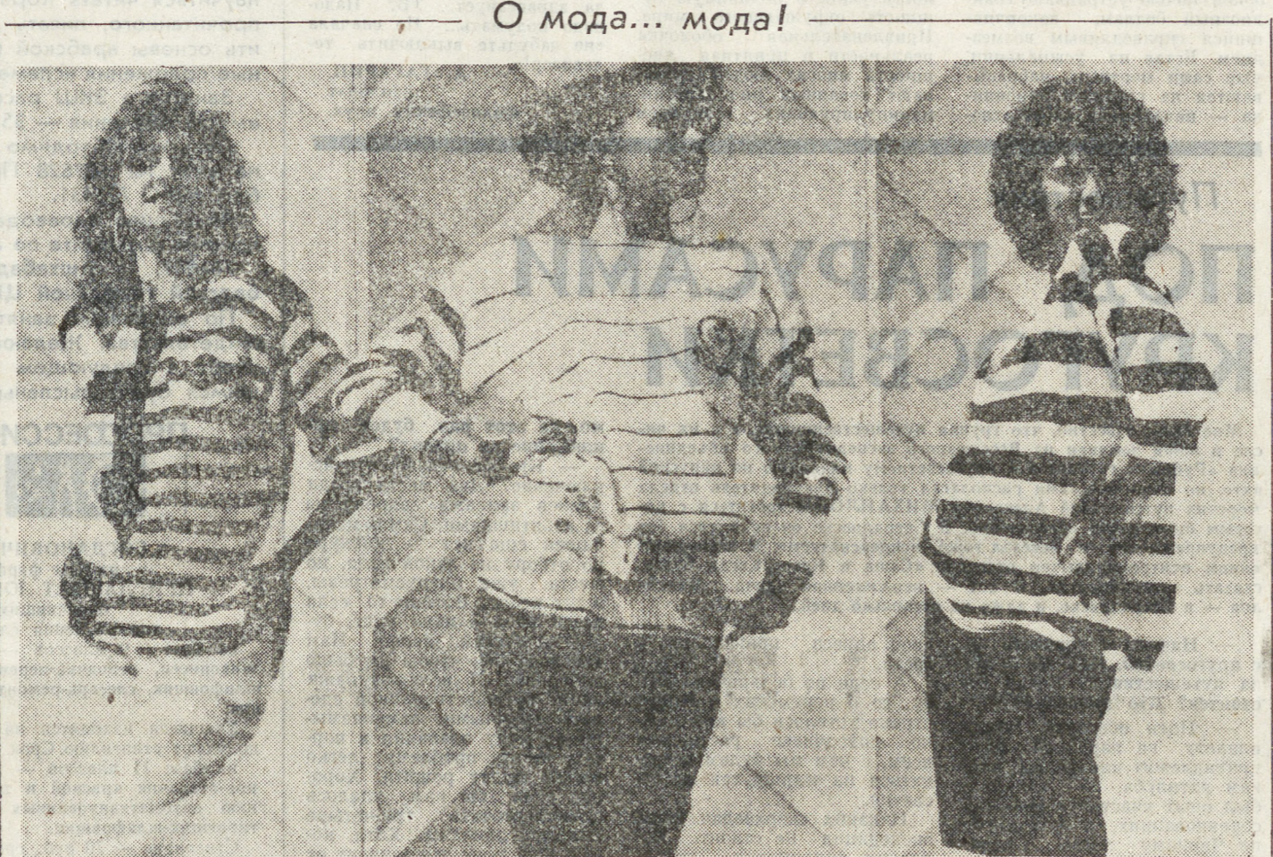
О мода... мода! ВАРШАВА. Полосатый верх — вот что модно в этом сезоне, так по крайней мере думают польские манекенщицы, демонстрируя модели одежды в старом городе Варшавы.

ному. Торговля оружием, безусловно, становится глобальной проблемой, требующей своего скорейшего разрешения. В этой связи серьезное внимание заслуживают предложения, изложенные в письме советского министра иностранных дел Эдуарда Шеварднадзе на имя генерального секретаря ООН. Речь идет о поиске новых подходов к вопросу международных продаж и поставок оружия. В письме это явление рассматривается, с одной стороны, как опасный канал распространения гонимого оружия на различных районах мира. С другой — говорится, что каждая государство имеет неотъемлемое право предусматривать оборонительные задачи. По данным одного из международных еженедельников, СССР поставил Ираку 1500 танков Т-62 и Т-72 (кстати, такое же количество поставил и Китай), около сотни самолетов-штурмовиков СУ-20 и СУ-25, 250 ракет класса «земля-земля» дальностью до 300 км и т. д. Вряд ли это оружие можно отнести к чисто оборонитель-