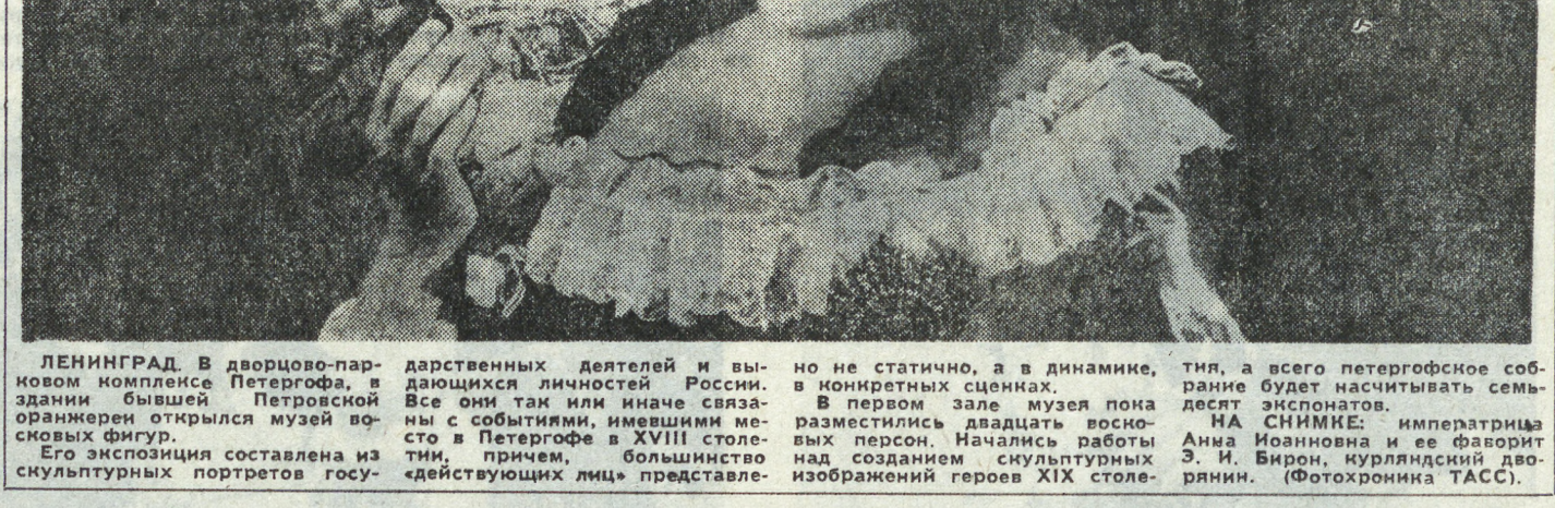
ЛЕНИНГРАД. В дворцово-парковом комплексе Петергофа, в здании бывшей Петровской обсерватории открылся музей воюющих фигур.

Его экспозиция составлена из скульптурных портретов государственных деятелей и выдающихся личностей России. Все они так или иначе связаны с событиями, имевшими место в Петергофе в XVIII столетии, причем, большинство изображений героев XIX столетия, а всего петергофское собрание будет насчитывать семьдесят экспонатов.