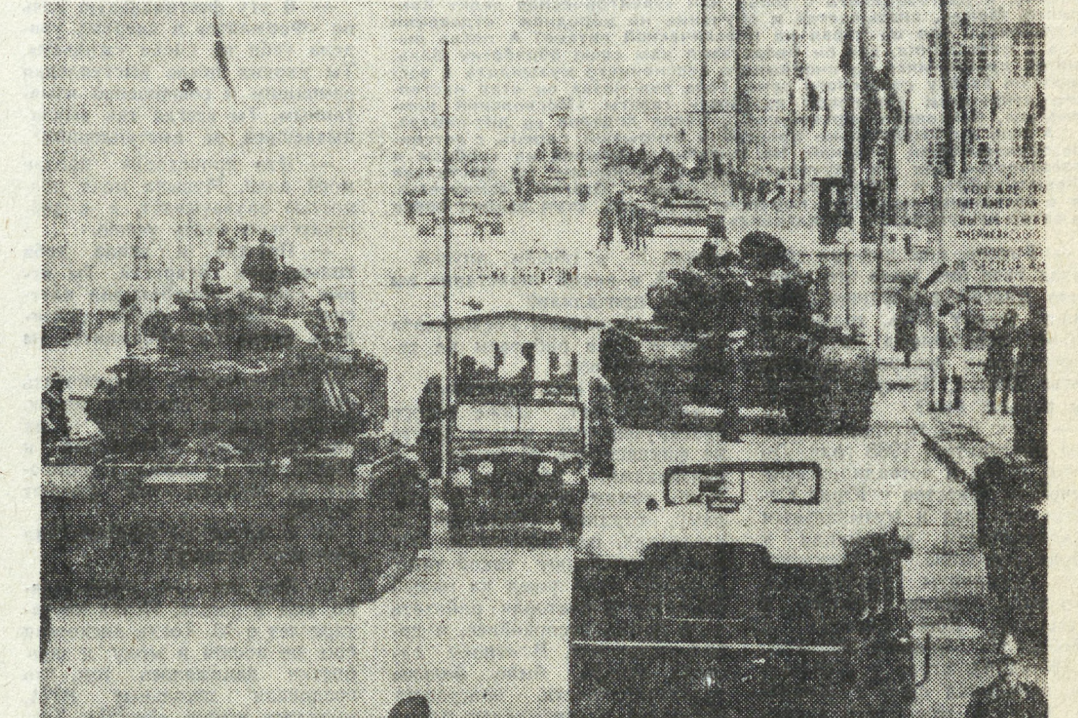
НА СНИМКЕ: Берлин, октябрь 1961. Протестующие бывших союзников. Тогда здравый смысл победил.