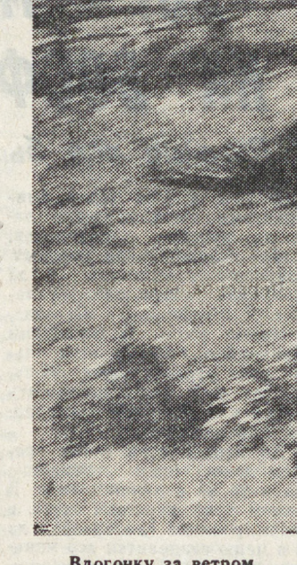
Вдогонку за ветром.

Фольклор — это результат столетиями отлаженного бытия, ведро молодое искусство, искусство жить. От чего все наши белы и пороки — пьянство, наркомания, стресс? Только от недостатка культуры, — считает Калужский. — Сюда будут приезжать специалисты, ученые, консультировать людей, как вести хозяйство, помогать создавать особый микроклимат.