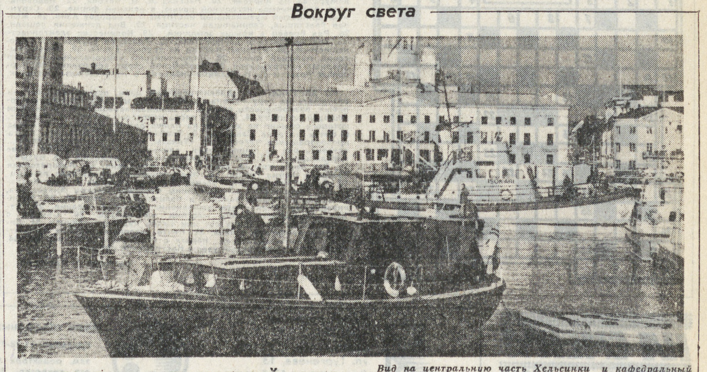
Вид на центральную часть Хельсинки и кафедральный собор со стороны Южного порта.

воде заставила недавно осветить выпуск разливного пива, которое пришлось по вкусу жителям Вьентьяна, ведь оно дешевое и не содержит добавок — консервантов. Для его хранения торговцы в спешном порядке стали обзаводиться большими баками-холодильниками. Особый разговор — цена. Заводская оптовая сравнительно невысока — 400 киллов (около полудоллара) за бутылку. Розничные продавцы устанавливают ее по своему усмотрению. Так, в разных местах она может достигать 700, а в праздники — 900 киллов. — Что мешает вам самим понизить цену на свою продукцию и получать больше прибыли? — спрашиваю Бункита. — Во-первых, рентабельность наша и без того высока, — отвечает он. — Во-вторых, всякое повышение оптовой цены повлечет непоправимые в виде роста розничных цен, тогда могут возникнуть трудности со сбытом. Покупают отладут предпочтительно импортному баночному пиву — оно его сколько! — А где предприятие берет валюту для покупки сырья? — О, у нас это довольно просто. Любая компания может получить в государственном банке доллары в обмен на свои киллы, представив, разумеется, убедительное обоснование. Секрет в том, что курсы официальный и чер-