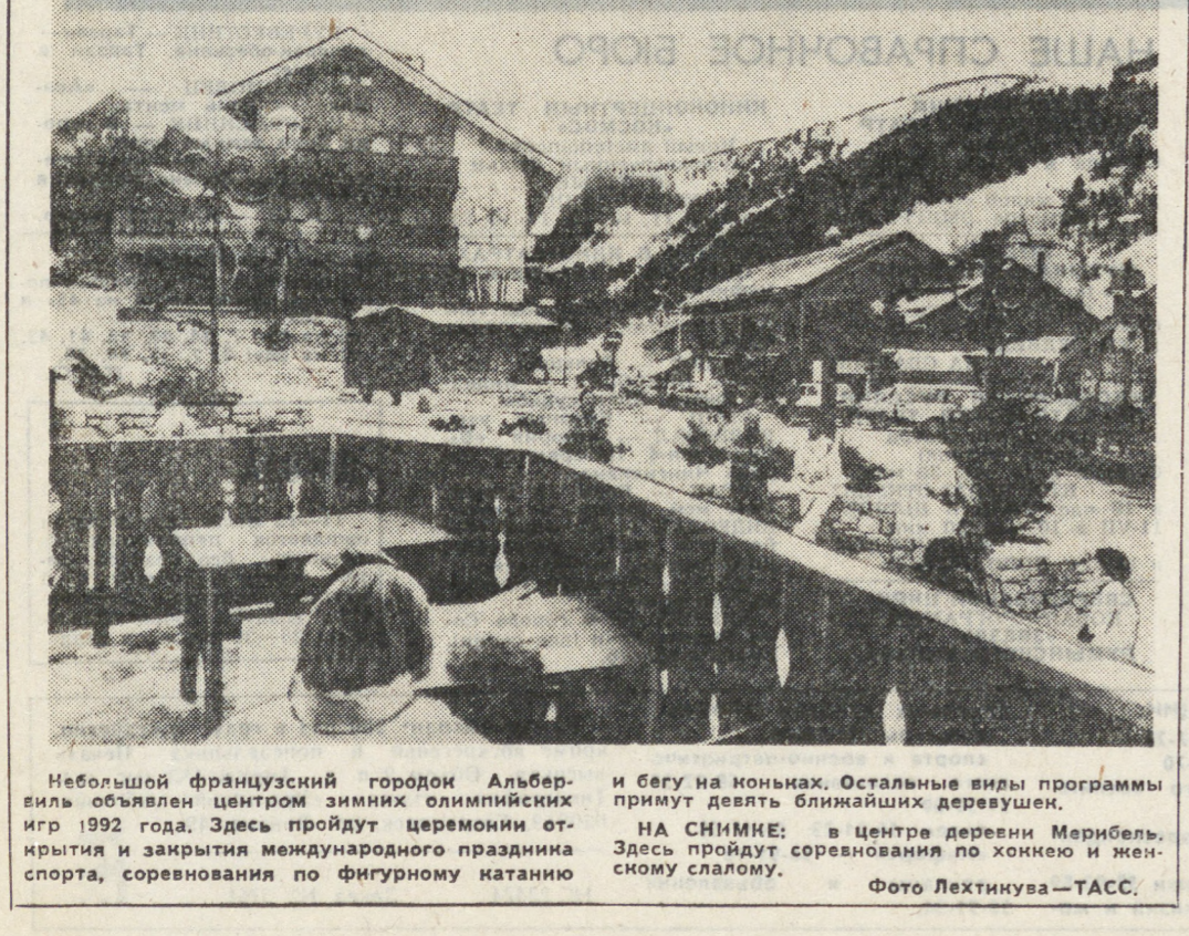
Небольшой французский городок Альпбиль объявлен центром зимних олимпийских игр 1992 года. Здесь пройдут церемонии открытия и закрытия международного праздника спорта, соревнования по фигурному катанию и бегу на коньках. Остальные виды программы примут девять ближайших деревушек. (ТАСС).

Режим наибольшего благоприятствования создан по многим пекинским кинотеатрам для «мандаринских уток» — так называют в КНР молодые парочки, предпочитающие покупать билеты исключительно на задние ряды. Теперь они получили официальный статус — в 8 из 17 кинотеатров китайской столицы установлено около 400 специальных двойных кресел. Расположены они в последних рядах балкона, где влюбленные могут спокойно поговорить. Расчет управляющих кинотеатрами прост: квартиры пекинцев переполнены настолью, что молодой паре досажает вряд ли найдется место, а уютнее в поздний час на скамейке городского парка вовсе не безопасно. Гораздо надежнее приобрести билет в кино на «два посадочных места» — благо заинтересованность здесь обоюдная: менеджер столичного кинотеатра «Кэпитал синама» Лю Хонь Пен получает немалый доход от 69 двойных кресел. В переводе на валюту США — это такое кресло стоит 85 центов — в 4 раза дороже самого дешевого «ординарного» места. «69 кресел для влюбленных приносит мне такую же прибыль, как и 400 простых мест», — заявила Лю Хонь Пен пекинским журналистам. А «мандаринские утки» частенько «залетают» к нему на «гоголек». Правда, признался Лю, полиция выразила, мягко говоря, сдержанное отношение к конфигурации кресел, которая позволяет молодым скрыться от посторонних глаз. (ТАСС).