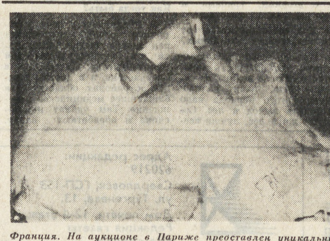
Франция. На аукционе в Париже простался уникальным экспонат — посмертная маска Наполеона Бонапарта, сделанная сразу после его смерти 5 мая 1821 года на острове Святой Елены.

О масштабах злоупотреблений некоторых осужденных своими постами можно судить по тому, что размеры неучтенных органами налогообложения владений, которые были вскрыты в ходе рейда, в десятки, а то и в сотни раз превышают их реальные доходы от заработной платы.