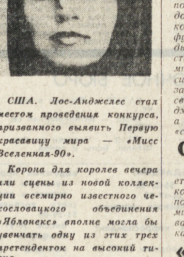
США. Лос-Анджелес стал местом проведения конкурса, призванного выявить Первую красавицу мира — «Мисс Вселенная-90». Корона для королевы вечера или сцены из новой коллекции всемирно известного целозащитного объединения «Яблоко» вполне могла бы увенчать одну из этих трех претенденток на высокий титул.