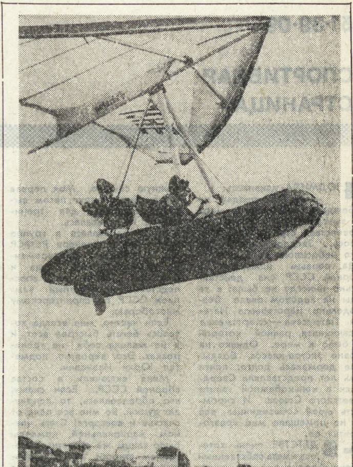
Всеобщее внимание своей оригинальностью на 29-й международной ярмарке плавающих средств в Генуе привлекла резинная надувная лодка «Полярис» весом около 200 килограммов с размахом крыльев более 10 метров и напоминающая крыло дельтаплана, которая взлетает с воды и может приземляться на землю. НА СНИМКЕ: захватывающий полет.