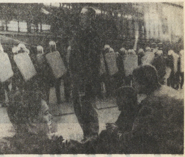
Нервными стали в ГАР сегодня для хулиганские акции фашиствующего характера со стороны молодежи. Крушение идеологического социализма, углубление кризиса в республике при предстоящем объединении с ФРГ негативным образом влияют на состояние умов, приводят к известной деградации моральных ценностей.

щением обычных вооруженных сил в Европе и тем, что происходит в мексиканских делах. Однако заключение соглашения в Вене не является заложником процесса объединения двух германских государств, тем более что этот процесс довольно длительный. (АПН.)