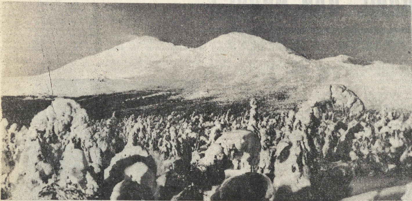
Человек и природа