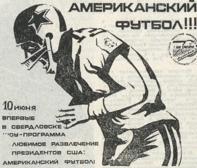
10 ИЮНЯ ВПЕРВЫЕ В СВЕРДЛОВСКЕ... ЛЮБИМОЕ РАЗВЛЕЧЕНИЕ ПРЕЗИДЕНТОВ США: АМЕРИКАНСКИЙ ФУТБОЛ!

Центральный стадион, 10 июня Заморская забава