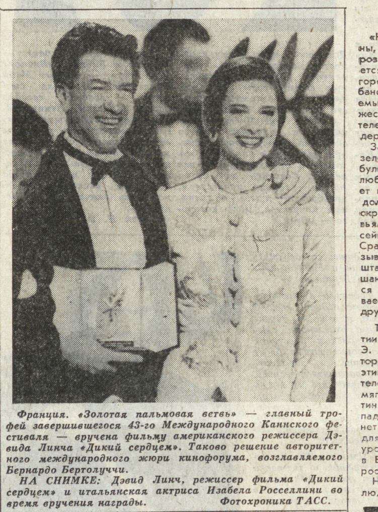
Франция. «Золотая пальмовая ветвь» — главный трофей завершающегося 43-го Международного Каннского фестиваля — вручена фильму американского режиссера Дэвида Линча «Дикий сердце». Такое решение авторитетного международного жюри кинофорума, возглавляемого Бернардо Бертолуччи. НА СНИМКЕ: Дэвид Линч, режиссер фильма «Дикий сердце» и итальянская актриса Изабелла Росселлини во время вручения награды.

Чередное празднование Международного женского дня на Мальте и натолкнуло наиболее решительных представительниц «сильного» пола на решение образовать Ассоциацию по защите прав мужчин. Прошло совсем немного времени, и ассоциация, насчитывающая уже более 200 членов, собралась на первый съезд. О чем же наиболее горячо спорили мужчины? В первую очередь — о супружестве. «Может ли кто-нибудь вспомнить случай, когда женщину привлекли к уголовной ответственности за то, что она не позволила своему мужу встречаться с сыном или дочерью? — спрашивали возмущенные ораторы. — А вот мужчина задрожать может угнать в тюрьму за неуплату алиментов». На и сами алименты... Некоторые мужчины, заводящий один из выступлений, просто не имеют стимула работать, поскольку после их уплаты остаются жалкие гроши.