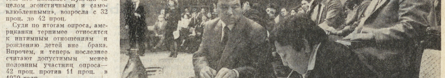
Казахстан и Страну восходящего солнца соединили телемост «Семипалатинск—Хиросима» в пятницу. В эфире участвовали операторы и журналисты обеих стран.

На Казахской студии телевидения состоялся телемост «Семипалатинск—Хиросима», соединивший Казахстан и Страну восходящего солнца.