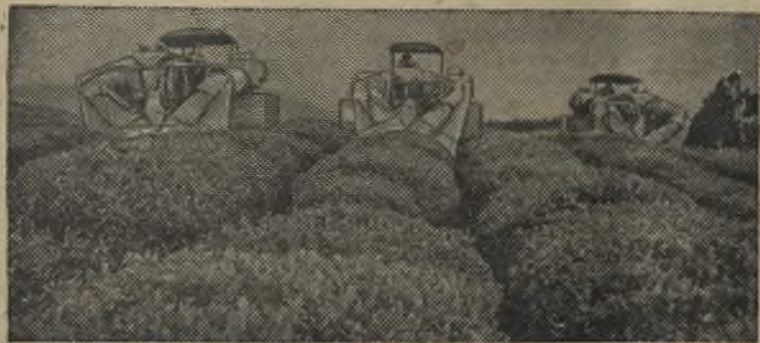
Адджарская АССР. Машины «Сакартвело» на сборе зеленого листа на чайных плантациях Очхамурского совхоза (на снимке вверху).