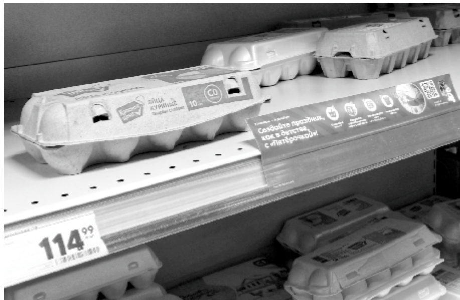
А яйца несмотря на цены разбираются очень активно

Чтобы вычислить индекс оливье в Заречном, мы высчитали среднюю стоимость за каждый продукт, сопоставив цены в пяти сетях. Получилось, что килограмм картофеля в среднем стоит 17 рублей (в 2022 году - 25 рублей), килограмм моркови - 33 рубля (было 27