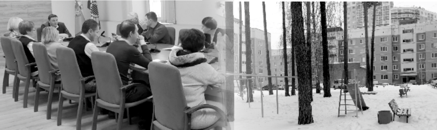
Согласительная комиссия решила, что в Простоквашино новая площадка не нужна

Деньги на баню увеличили, а детям из Простоквашино отказали.