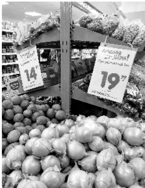
Овощи стоят дешевле, чем в прошлом году

Глава государства рассказал, что недавно обсуждал этот вопрос с министром сельского хозяйства России и