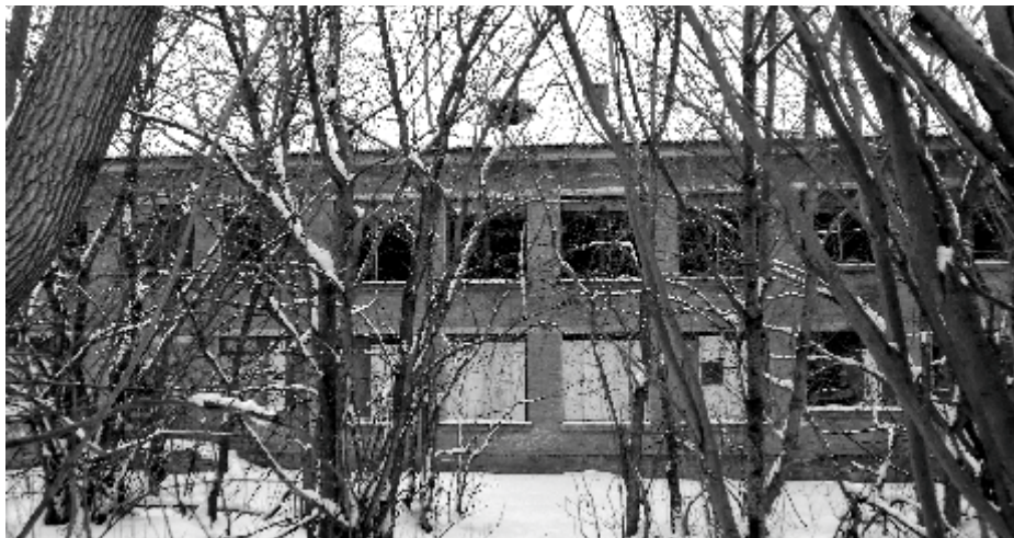
Судьба детского сада опять непонятна...

В конце мая этого года глава Захарцев сообщил, что в отношении данного участка осуществляются мероприятия по подготовке электронного аукциона... А в ответ на наш информационный запрос администрация недавно пояснила, что «В отношении земельного участка проведена оценка: объект оценен в 1 млн 358 тысяч рублей. Земельный участок выставлен на торги». За