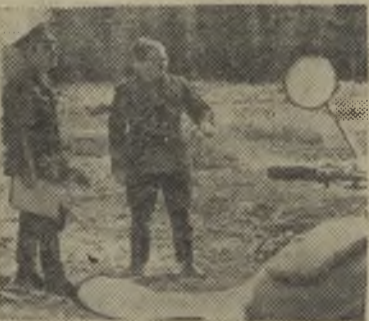
Архангельск. Вельский лесхоз. Ежегодно в области засевают лесом более 37 гектаров и на такой же площади проводят мероприятия по содействию естественному возобновлению леса.

Идейно-патриотическое воспитание старшекласников... Оно должно быть глубоким по содержанию, интересным, романтическим по форме. Таким является политическое просвещение учащихся. Оно знакомит детей с событиями внутри страны за рубежом с трудами Маркса, Энгельса, Ленина. И прежде