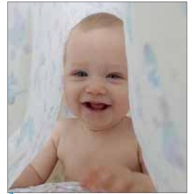
Яркий лучик света