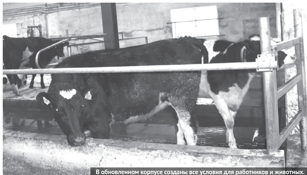
В обновленном корпусе созданы все условия для работников и животных.

На молочно-товарной ферме №3 ООО «НП Искра» в селе Кунарском завершили работы по реконструкции всех помещений для беспривязного содержания крупного рогатого скота. Недавно состоялось торжественное открытие четвёртого коровника