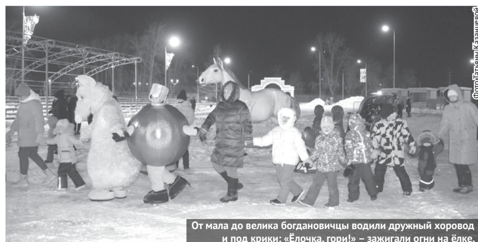
От мала до велика богдановичцы водили дружный хоровод и под крики: «Ёлочка, гори!» – зажигали огни на ёлке.