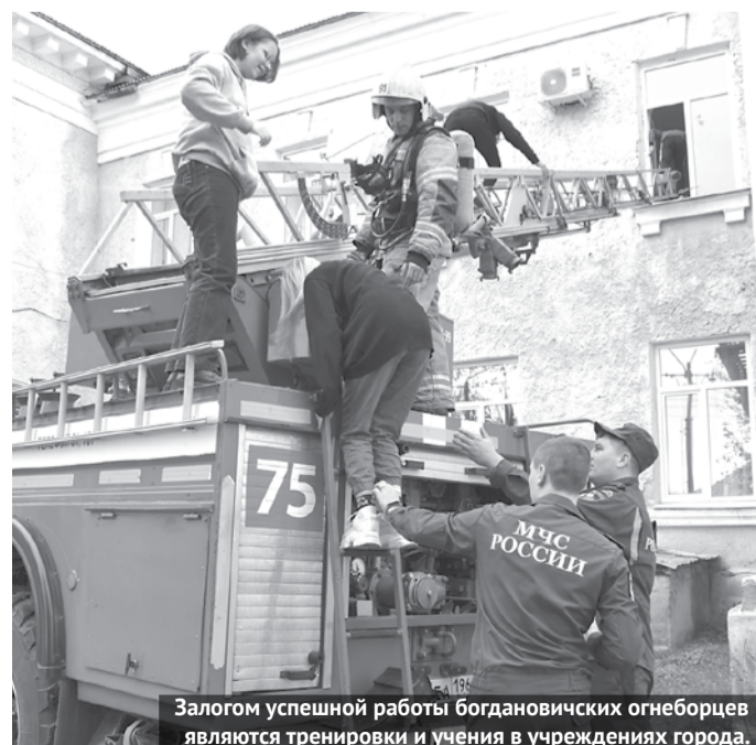
Залогом успешной работы богдановичских огнеборцев являются тренировки и учения в учреждениях города.

Наши спасатели всегда работают через не могу, постоянно на пределе своих возможностей