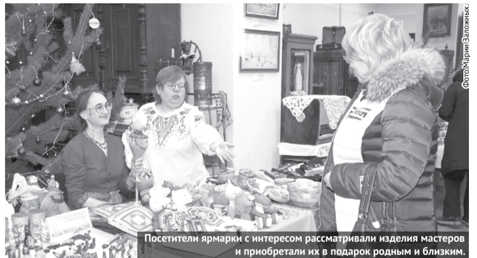
Посетители ярмарки с интересом рассматривали изделия мастеров и приобретали их в подарок родным и близким.