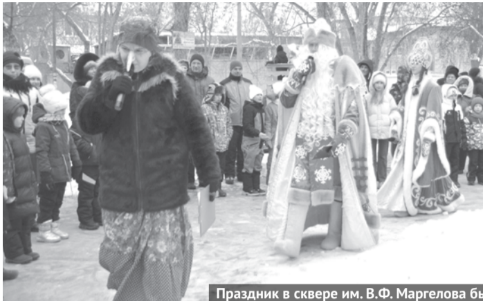
Праздник в сквере им. В.Ф. Маргелова был наполнен играми, весельем и подарками.

В конце ноября Союз десантников ГО Богданович объявлял сбор новогодних самодельных игрушек для украшения ели, которая ежегодно устанавливается в сквере им. В.Ф. Маргелова. Нынче юные богдановичцы изготовили и принесли их более 200