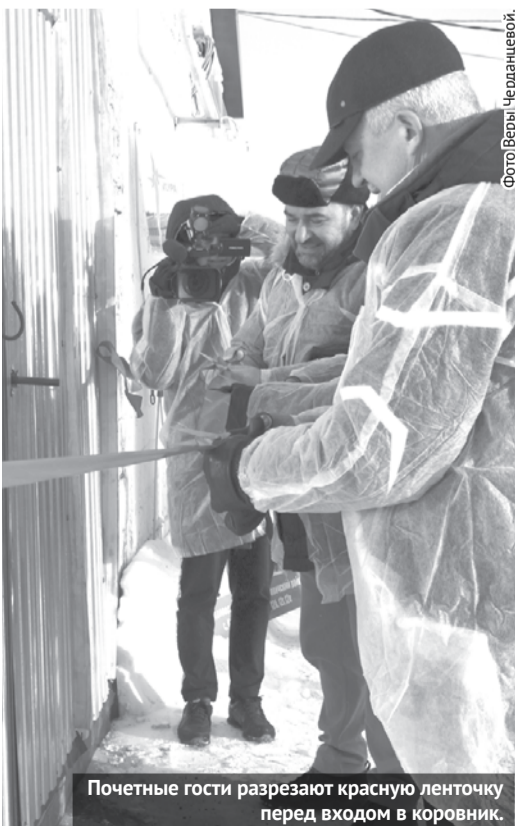
Почетные гости разрезают красную ленточку перед входом в коровник.