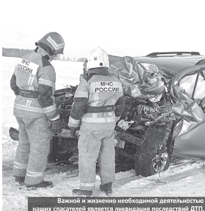
Важной и жизненно необходимой деятельностью наших спасателей является ликвидация последствий ДТП.