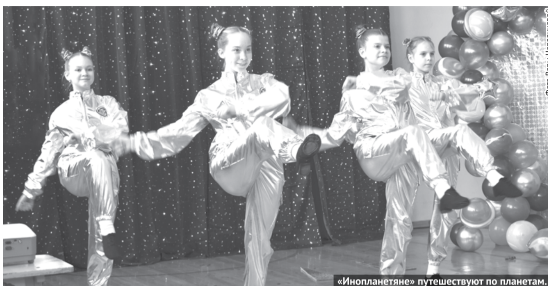
«Инопланетяне» путешествуют по планетам.

Кунарская школа отметила 55-летний юбилей. В это день ухоженная и нарядная она гостеприимно распахнула двери для гостей, которые, войдя в здание, попадали в атмосферу праздника