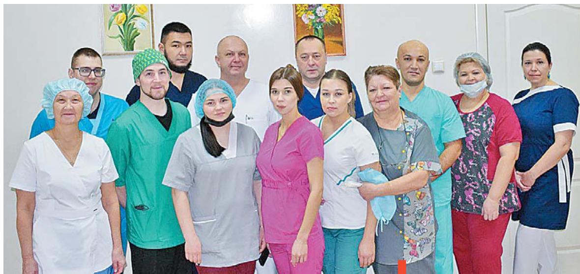
Обновленный коллектив хирургического отделения Суходольской РБ