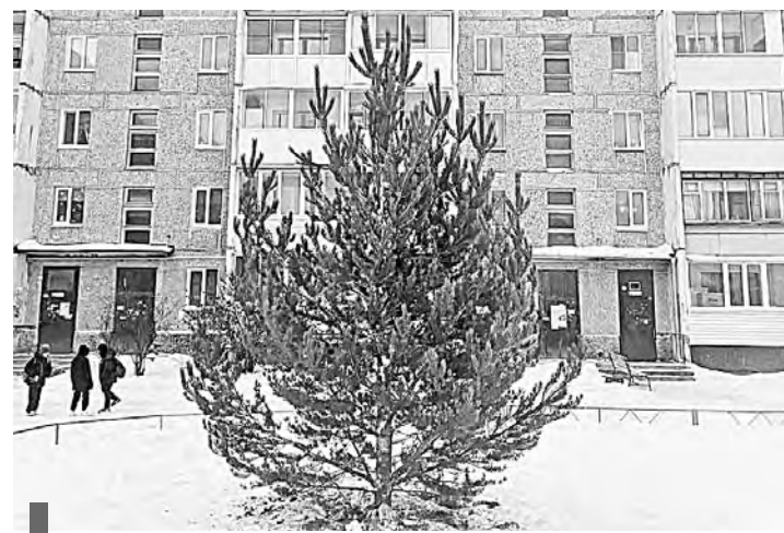
Лесная красавица во дворе дома №5 в пер. Школьном

Добрая традиция будет соблюдена и теперь. Елки украсят дворы домов в пер. Школьном, 5, на ул. Белинского, 16, 30, 30А, Буденного 3, 3А, 5, 5А, Гоголя, 13 и 15, Гоголя, 54 и 56, Кирова, 5, Юбилейная, 9, 9А, 9Б, и пр. Строителей, 5. Хороших новогодних каникул и праздничного настроения!