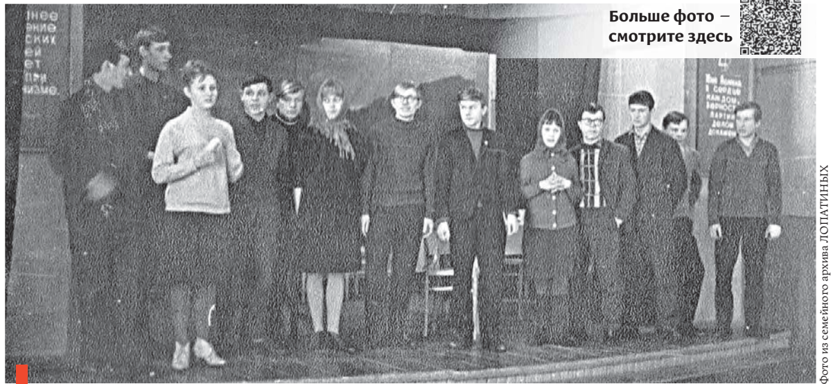
На сцене школы №2 старшеклассники из театра «Романтик» – участники спектакля «Они и мы»

Да, Елизавета Николаевна умела увлечь молодежь к высотам знаний, к духовным богатствам мира.