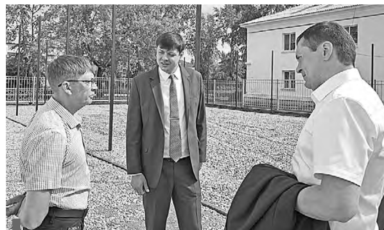
Строительство спортивной площадки шк. №2

енной операции освобождаются от уплаты транспортного налога. Действие закона распространяется на один зарегистрированный легковой автомобиль с мощностью двигателя от 100 до 200 лошадиных сил.