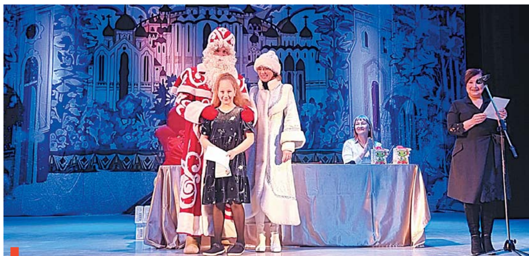
Участники и призеры награждены дипломами и сладкими подарками