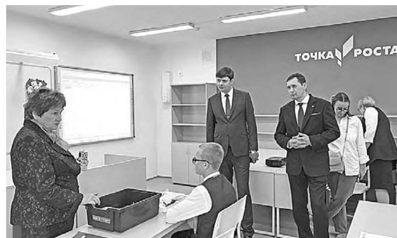
«Точка роста» в шк. №9 с. Рудянского