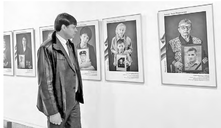
Открытие фотовыставки «Мамы героев»

– Изменения в закон «О социальной поддержке ветеранов в Свердловской области» причисляют к категории получателей социальных гарантий в сфере газификации участников специальной военной операции на территориях Украины, ДНР, ЛНР, Запорожской и Херсонской областей или одного из совершеннолетних членов его семьи. В случае гибели участника СВО компенсация предоставляется вдове (вдовцу) этого человека. Участники специальной во-