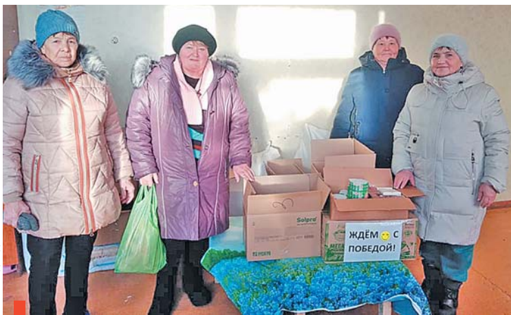
Жители села с частью собранного гуманитарного груза