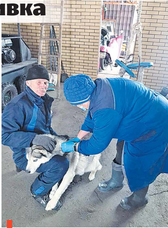
Процедура вакцинации от бешенства быстрая и безболезненная

животного/человека (при укусе или оцарапывании). Вирус не передается от человека к человеку! Профилактика заболевания – своевременная вакцинация и контроль за поведением питомцев. В случае подозрения на имевший место контакт с больным животным следует незамедлительно обратиться в ветстанцию или скорую помощь (если речь идет о человеке). Признаки заражения: животное отказывается от воды, боится яркого света, прячется или агрессивно себя ведет.