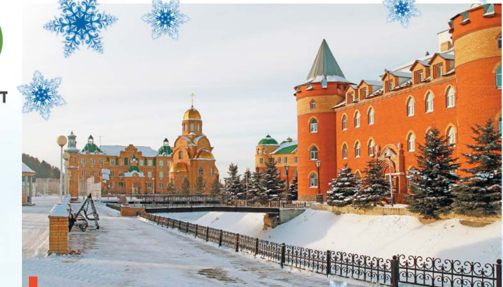
Зимняя сказка уральского курорта

САНАТОРИЙ «КУРЬИ» – одна из старейших водолечебниц. Территория санатория обширная, ухоженная, с большим количеством зеленых насаждений. Рекомендуем это лечебно-профилактическое учреждение тем отдыхающим, которые страда-