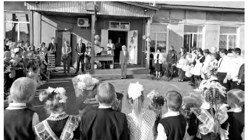
Киргишанская школа, 1 сентября, 2022 год

Всё лучшее в Киргишанах было отдано детдому. Школу перевели в двухэтажный жилой дом на улице Тракторной, а в освобожденном здании разместили сирот.