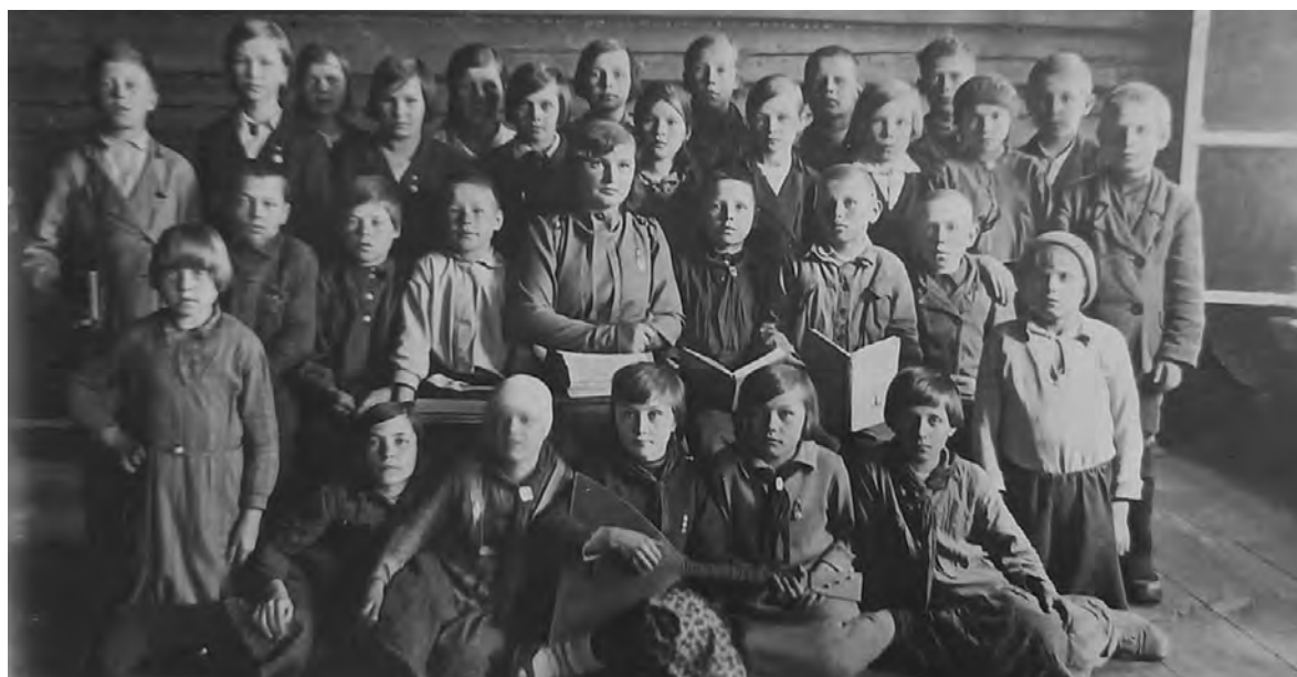
Киргишанская школа, 1 сентября, 1938 год

Педагогический коллектив МКОУ-ООШ с. Киргишаны.