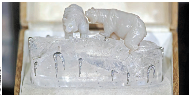
Композицию «Белые медведи на льдине» выставили за 40 миллионов.