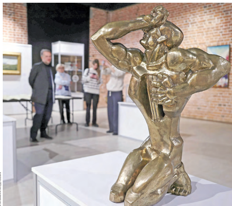
«Орфея II» Неизвестного на аукционе продали за 8,5 миллиона рублей.