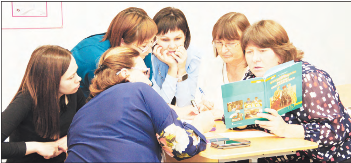
Составляем рабочую программу.

«За что ни берется русский человек, он это не только механически принимает, но и осваивает, творчески перерабатывает и развивает!»