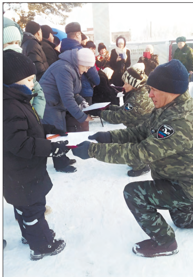
Вручается «Судьба солдата».