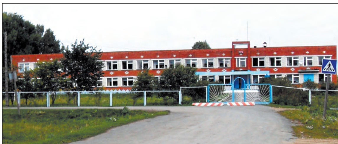
Сегодня школьному зданию уже 33 года