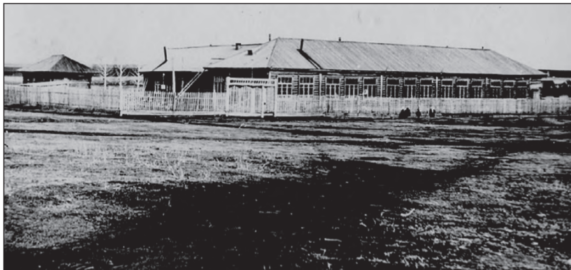
Школа 1936 года, построенная колхозами «вкладчину»