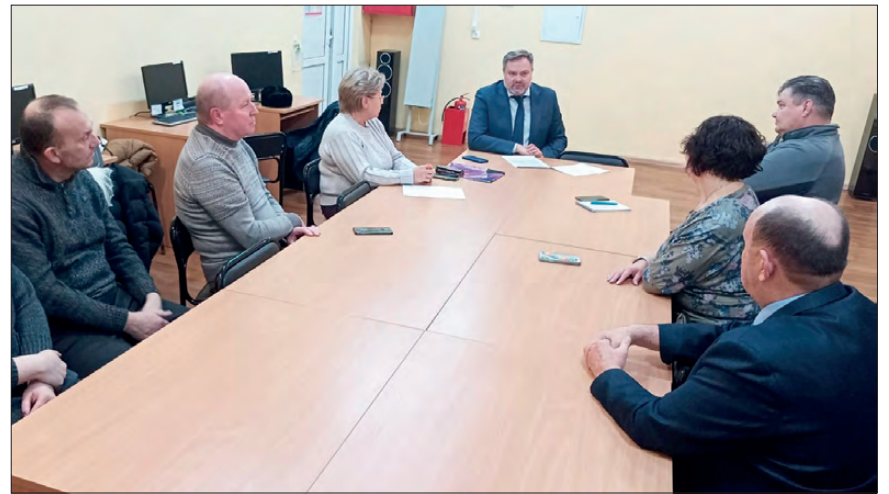
На заседании Общественной палаты городского округа Дегтярск представлен проект бюджета

В результате работы администрации городского округа Дегтярск при содействии Министерства строительства Свердловской области, депутатов и председателя Законодательного собрания Свердловской области Люд-