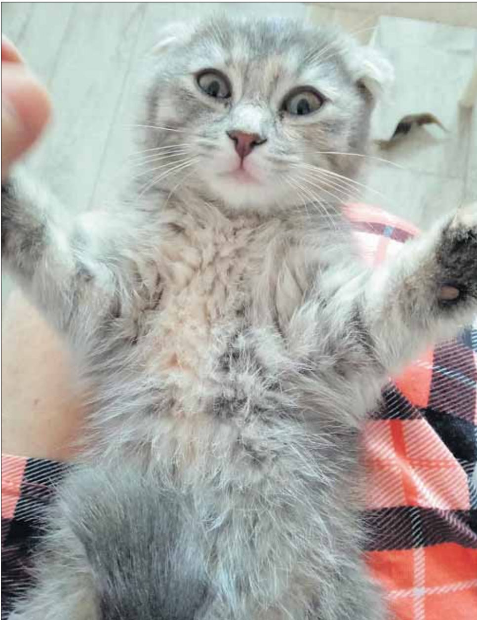
Этого котенка нашли на М.Горького, 52а. Сейчас ему ищут дом в «КошкинДоме».