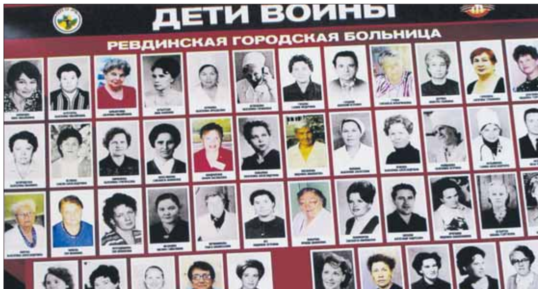
Фрагмент памятного календаря

Еще раз всем огромное спасибо за помощь! Поздравляю всех с наступающим Новым годом! Всем здоровья и благополучия!