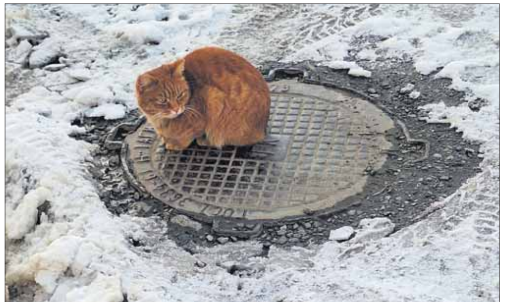
Этот кот живет на П.Зыкина, 44 во дворе.