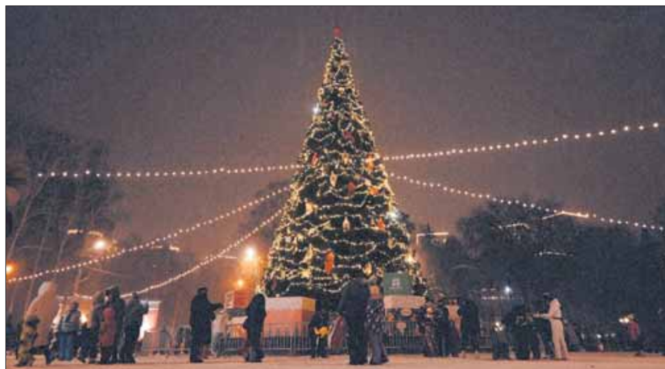
Фото: парк Маяковского

ПАРК МАЯКОВСКОГО. В парке Маяковского огромную (и очень красивую!) елочку зажгли в начале декабря. Ель помог украсить ЖК Clever park. По периметру главной аллеи натянули гирлянды. В парке уже построили гигантскую горку от банка «Тинькофф» (вход на нее платный), открыли лыжную базу, в выходные заляют каток «Северное сияние» (про это читайте на стр. 16), а еще заработают городские мастерские и Фабрика подарков Дедушки Мороза с тематическими экскурсиями. В общем, здесь уже совсем-совсем празднично.