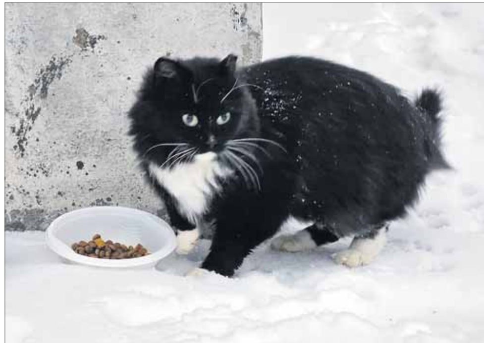
Эта кошка живет на улице, ей ищут дом: 8(900)198-68-38.

! Если у вас есть автомобиль — возьмите за правило зимой, перед тем как ехать, заглядывать под машину — не сидит ли под капотом кошка. Часто животные в поисках теплого укрытия прячутся именно там. Замерзший кот может не успеть убежать, когда вы резко заведете мотор.