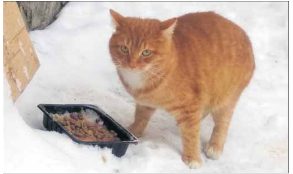
Этого кота в ноябре нашли на М.Горького. Пристраивают: 8(902)878-63-67.