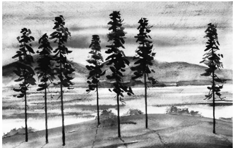
Иллюстрация: В.И. Бердышев. Семь красавиц на Ильмене