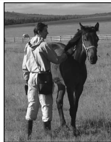
ФОТО ИЗ ДАЛЬНИХ СТРАНСТВИЙ