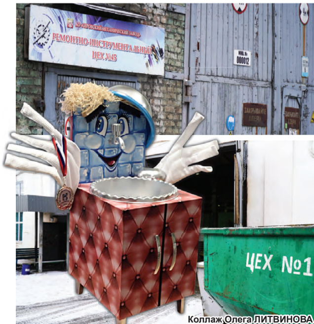
Коллаж Олега ЛИТВИНОВА