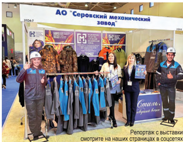
Репортаж с выставки смотрите на наших страницах в соцсетях