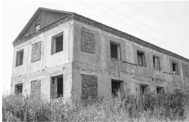
Тот самый дом и та самая столовая.

В ближайших планах – и строительство нового здания столовой с круглогодичным режимом работы. Нынешняя, сезонная, на период горячих работ располагается в бревенчатой избе, которой более ста лет. Новостройкой «Заря» намеревалось заняться еще лет пять назад, но в администрации района на два года(!) затянулась процедура оформления земельного участка.