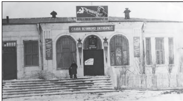
Клуб в 60-е годы 20 века

В кирпичном здании с арочными окнами собрания товарищества имелась кооперативная лавка. Потом здесь была «Изба-читальня», затем - «Народный дом», в котором показывали черно-белое кино