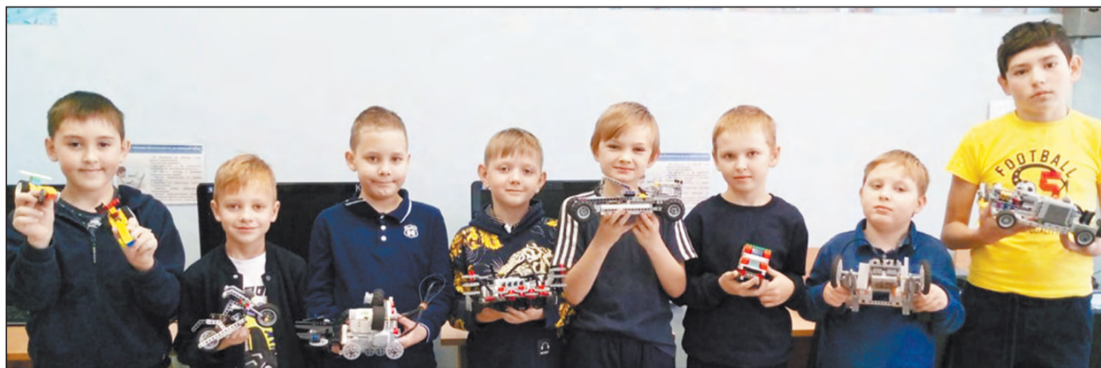
Фантазеры младшего возраста

В ЦДО прошел конкурс робототехнических устройств «Транспорт будущего»