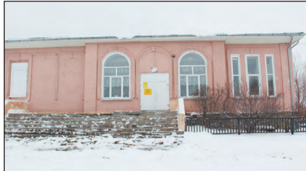
Здание клуба в наши дни