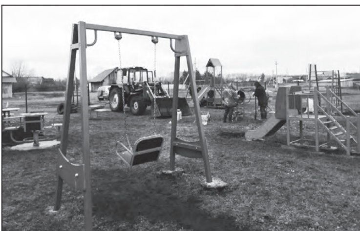
Прибежали все и сели на качели-карусели!