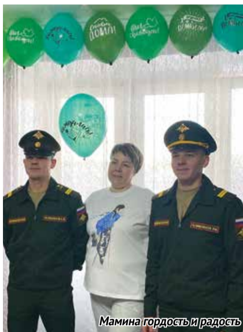
Мамина гордость и радость

всего года службы оказывали солдатам родители, родственники и друзья. Грело братьям душу и то, что в родном городе их ждали любимые девушки!