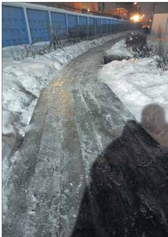
Так выглядел подход к переправе около Шараминского моста утром 30 ноября.

— Хорошо, сегодня было сделано частично. Я сегодня искренне благодарю мужичка, который раскидывал отсев. Шутка про фен правда не в те-