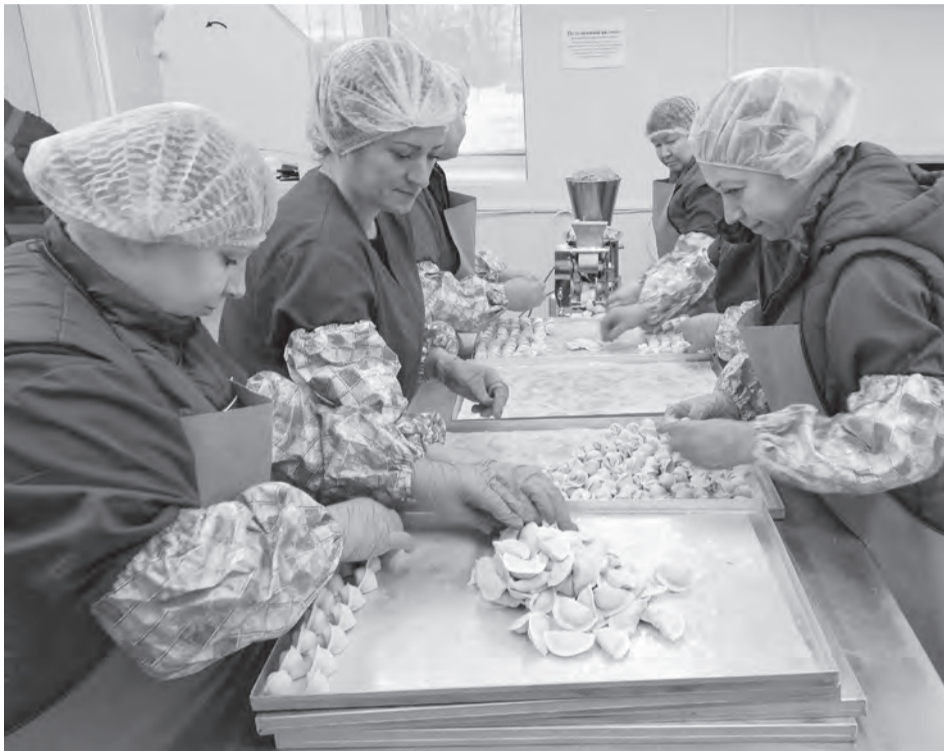
Эти пельмени едят тоннами

талицких полуфабрикатов, в том числе пельменей - в АО «Талицкое». Действительно ли продукция изготавливается из натурального мяса и не содержит многочисленных консервантов, сою и мясо механической обвалки?..