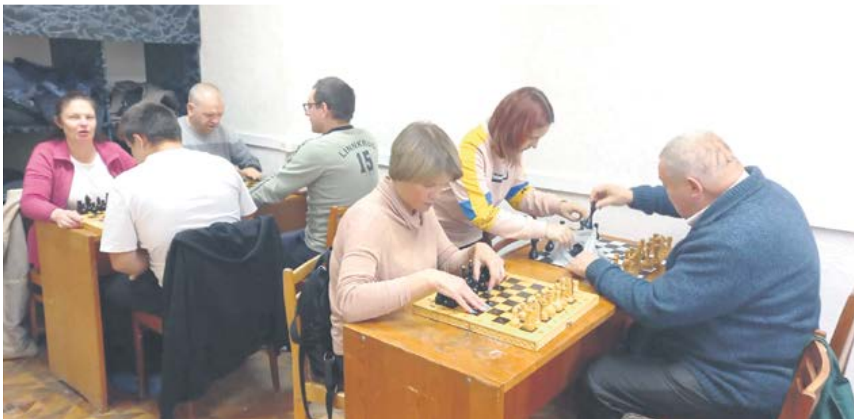
В кружке по шахматам и шашкам вовсю идёт подготовка к турниру между членами Ревдинской МО ВОС.