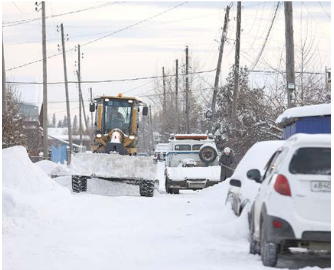
Вот в таком сопровождении полицейской машины шла в понедельник, 27 ноября, очистка от снега Индивидуального поселка.

Розыгрыш пройдет 8 декабря в эфире новостей ТК «Единство» на телеканале «360» в 19:20