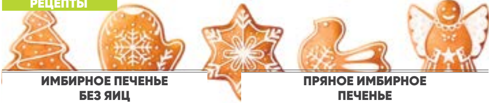
ИМБИРНОЕ ПЕЧЕНЬЕ БЕЗ ЯИЦ