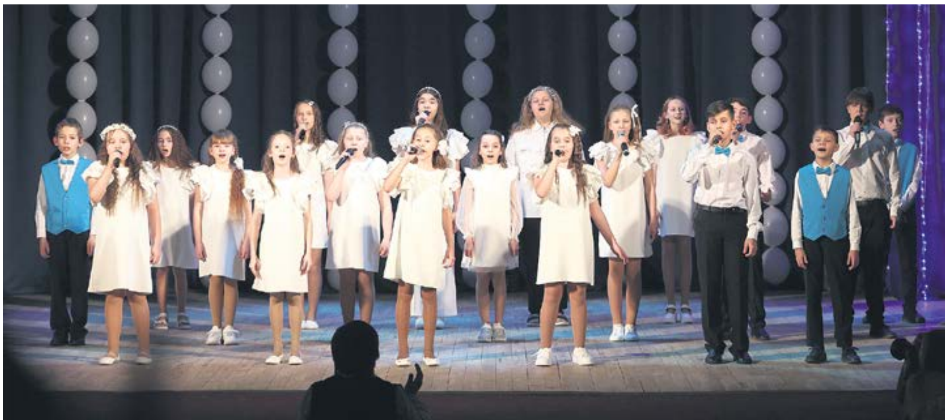
Второй год подряд школьный хор «Созвездие» получает первое место в номинации «Сводный хор».

В неторжественной части для участников провели мастер-классы по ораторскому искусству, проведению интерактивных занятий и видеосъемке. Также добровольцам показали фильм «Мама, я вырасту» и обсудили с ними тему абортов. В конце программы все команды обменялись подарками, привезенными из своих учреждений.