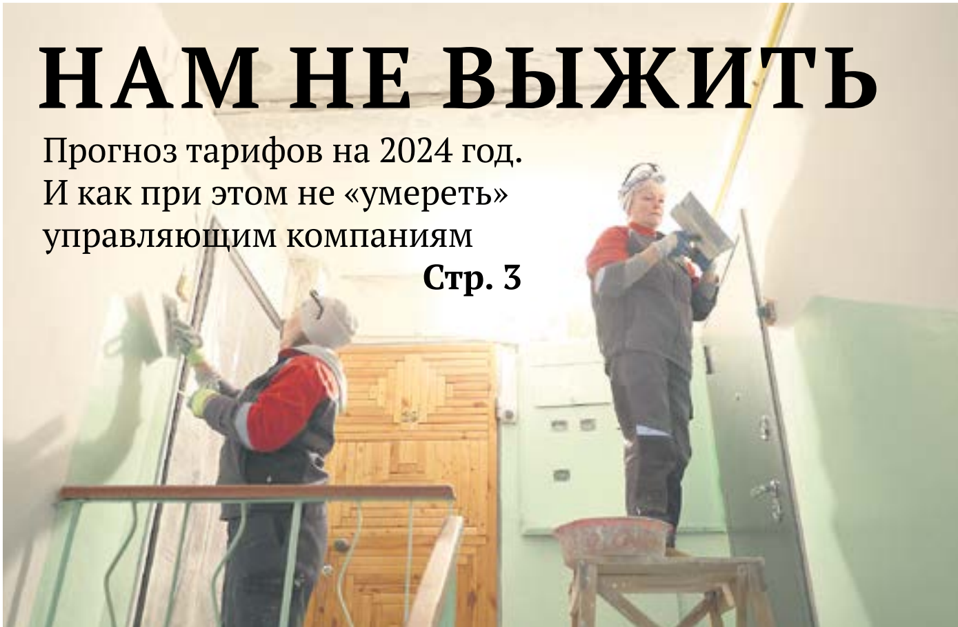
Жители, не соглашаясь повышать тариф на содержание жилфонда, становятся виновниками того, что ремонтировать подъезды домов оказывается не на что. А скоро будет еще и некому.

Прогноз тарифов на 2024 год. И как при этом не «умереть» управляющим компаниям Стр. 3