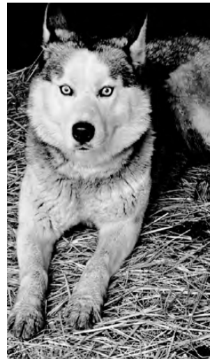
ХАСКИ. Молодая, очень красивая, активная, веселая