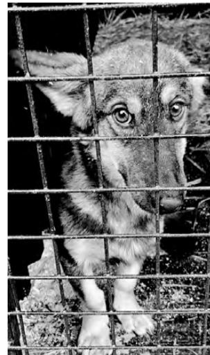
ЧИЖИК. Маленький пёсик, спокойный, ласковый, подойдет для квартиры