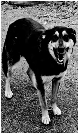
МУХА. Умная, послушная, хорошая охранница, приучена к цепи

В городе Реж в пункте кратковременного содержания безнадзорных животных находятся собаки и кошки, готовые обрести дом и любящих хозяев. Животные прошли ветеринарный карантин, поставлены необходимые прививки. Есть щенки и котята, возраст от 1 месяца до года. Если Вы хотите обрести друга и надёжного охранника, звоните по телефону 8-912-674-23-28. Мы можем доставить вам понравившееся животное. Уважаемые режевляне, если у вас есть возможность помочь кормом для животных, то мы с радостью примем крупы (кроме перловой - ее собакам нельзя), макаронные изделия, кости, лапки кур, хлеб, сухари, сухой корм. Заранее огромное всем спасибо.