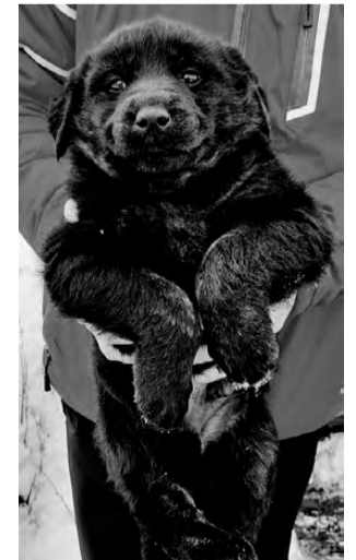
ЩЕНКИ. Здоровяки, возраст 2 месяца. От крупной собаки