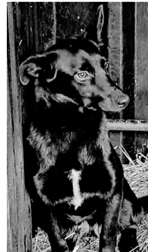
НОЧКА. Возраст 8 месяцев, спокойная, приучена к вольеру