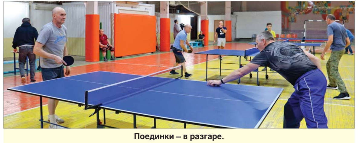
Поединки – в разгаре.

В течение двух вечеров в зале спорткомплекса предприятия звучала музыка. Размеренный стук мячей о поверхности теннисных столов раздавался 23-го и 28-го ноября. Командное первенство провели в обеих группах цехов.