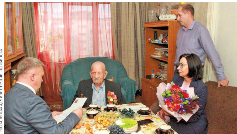
Ветерана в домашней обстановке поздравили глава Челябинска Наталья Котова и главный федеральный инспектор региона Денис Чернышев.