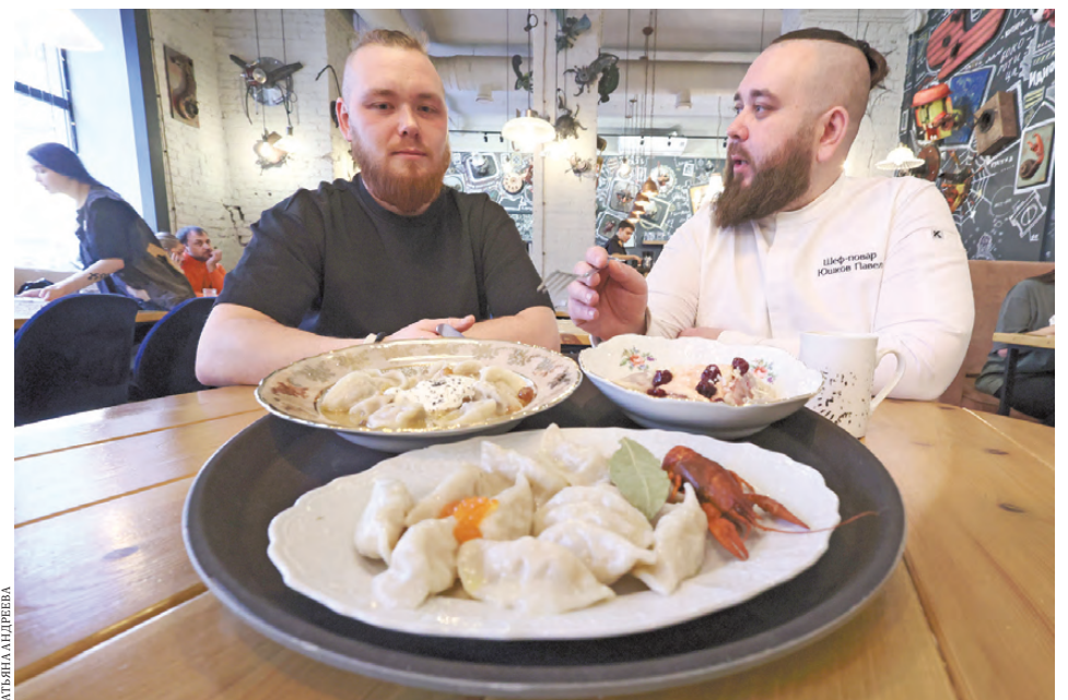
Шеф-повара — самые взыскательные дегустаторы.

Кстати, фестиваль продлится до 3 декабря, в нем участвуют кафе и рестораны Екатеринбурга, Челябинска, Тобольска и Перми. Посетителям, особенно тем, кто пройдет по нескольким адресам «Пельменного гида», предлагают проголосовать за любимый вариант.