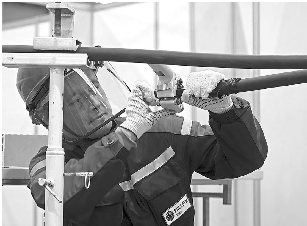
Особенность чемпионата высокотехнологичных профессий в том, что конкурсантам нужно не просто продемонстрировать мастерство, а проявить при этом смекалку и способность к техническому творчеству.