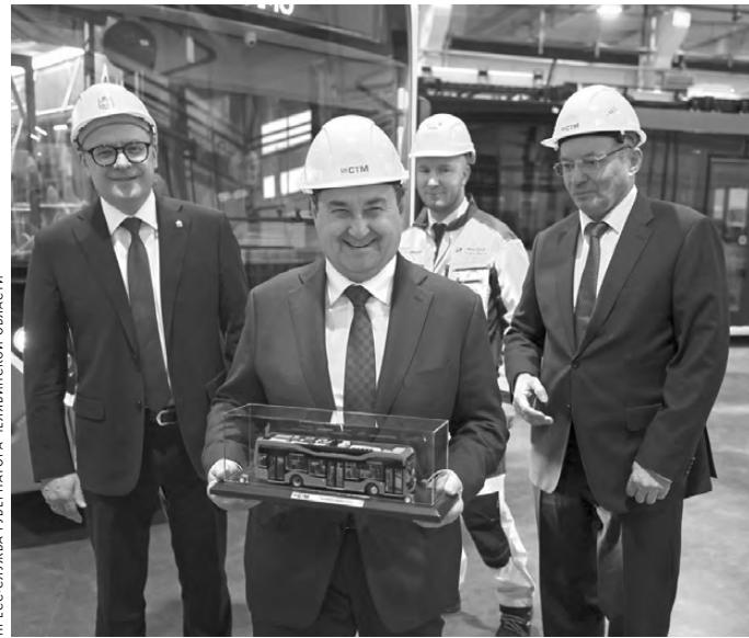
Успехи Южного Урала губернатор Алексей Текслер (крайний слева) продемонстрировал помощнику президента Игорю Левитину на новом производстве троллейбусов.

3Д-деньги Чтобы темпы экономического развития не снижались, государственные институты должны действовать осмысленно, не давить живую инициативу, но при этом активно включать различные страховочные механизмы для поддержки бизнеса, оказавшегося в сложной ситуации под влиянием внешних факторов. Речь не только о санкциях, но и о внутренних условиях. Так, глава Минэкономразвития РФ Максим Решетников отмеча-