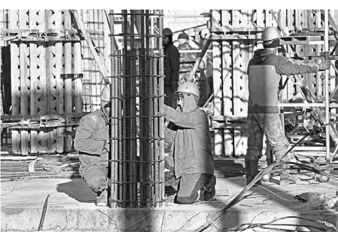
Пока большинство объектов уральские строители используют традиционные стальные конструкции.

Один из рисков факторов — колеблющаяся стоимость стали. Все прекрасно помнят удорожание арматуры на 40 процентов во время пандемии, поскольку внутренние цены были привязаны к торгам на Лондонской бирже металлов. Сами промышленники считают: снизить себестоимость квадратного метра поможет применение более прочных видов стали, расход которых меньше на 5–15 процентов, и цифровое проектирование, при котором вместо четырех недель на полный набор технической документации уходит всего 25 минут. ●