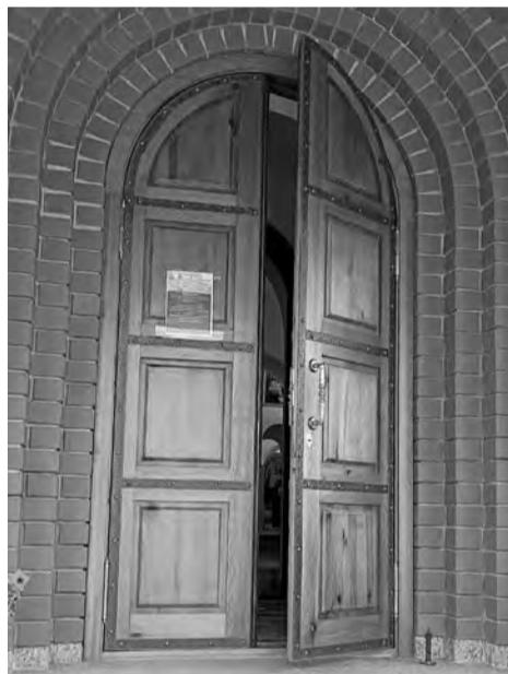
Новые входные группы из массива дерева заменят старые.