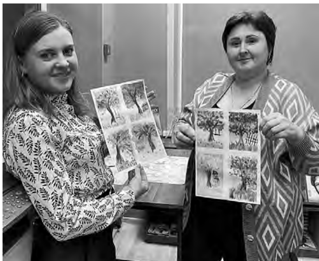
Фото Троицкой поселковой библиотеки.

Напомним, что в этом году Всероссийская акция «Ночь искусств-2023» была приурочена к Дню народного единства и прошла она под девизом «Россия объединяет». Акция посвящена многообразию культур России – старинным традициям и особенностям быта, музыки, танцам и литературе разных народов нашей страны.