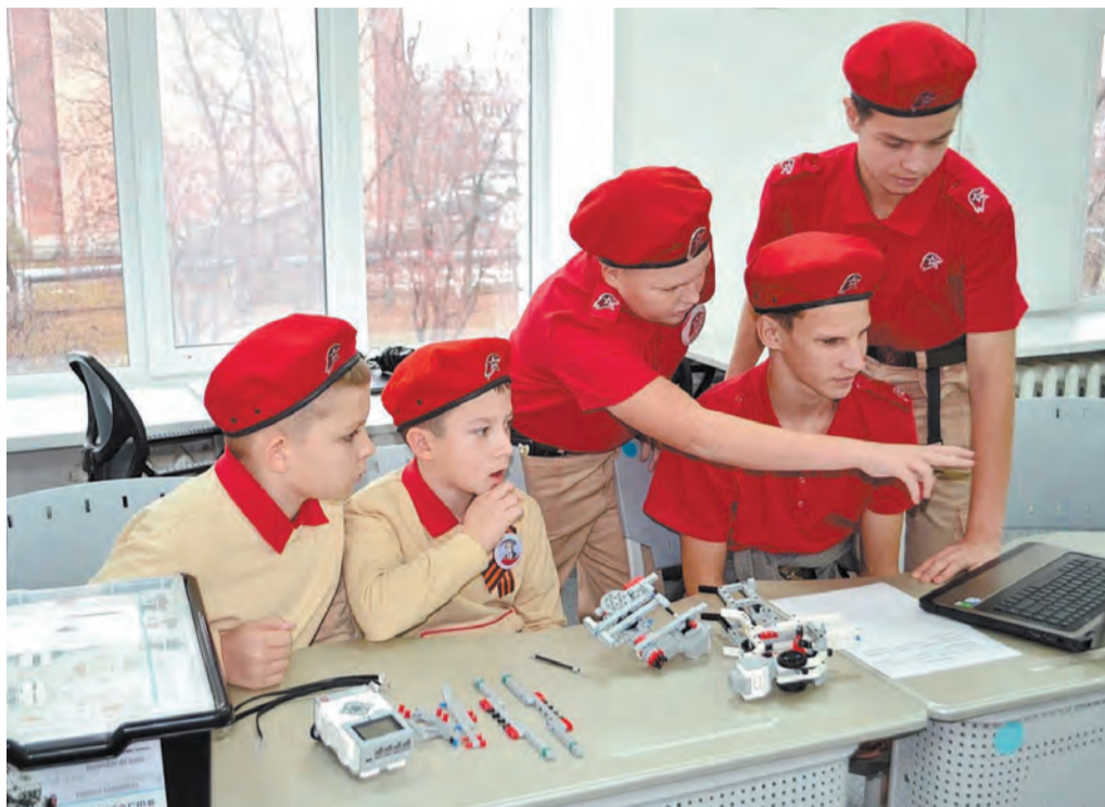
Фото участников форума.

Юнармейцы и их руководители как всегда были на высоте. Мероприятия под их эгидой всегда разнообразны и полезны. Договорились, что редакция газеты «Сельская новь» будет помогать талицким ребятам рассказывать о своей деятельности на страницах газеты. Будем прославлять их добрые дела и победы!