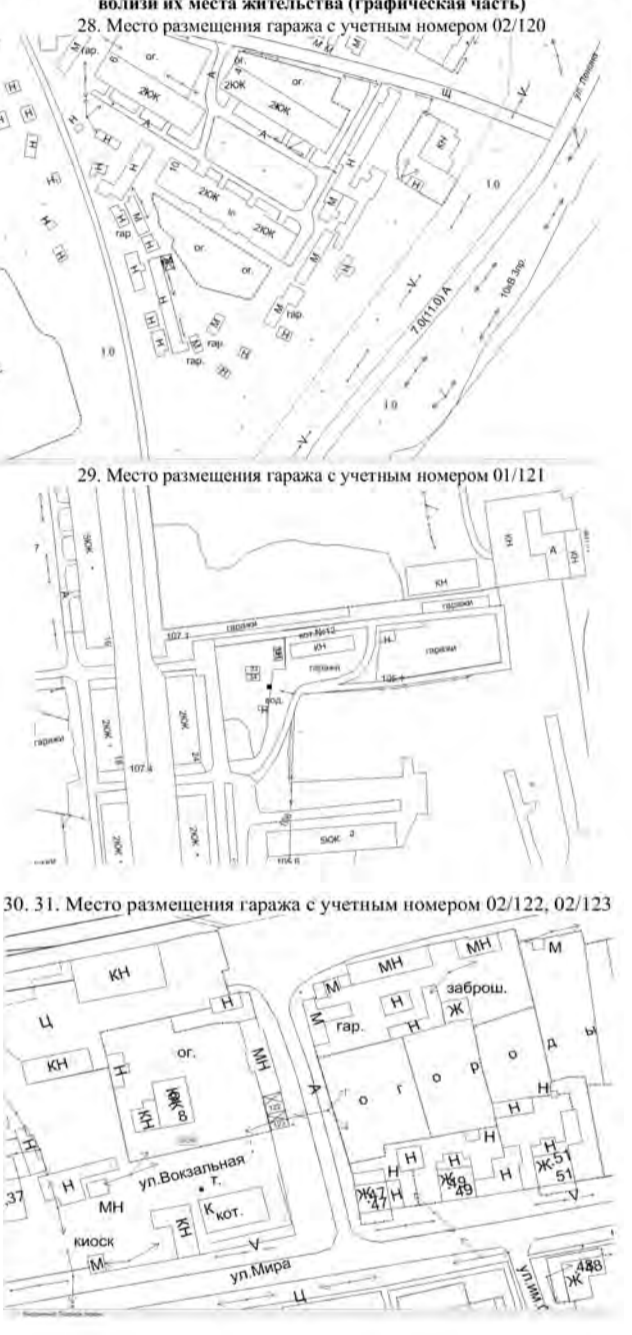
СХЕМА размещения гаражей, являющихся некапитальными сооружениями и мест стоянки технических или других средств передвижения инвалидов вблизи их места жительства (графическая часть)

Администрация Талицкого городского округа от 02.11.2023 № 986