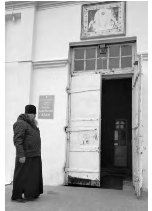
Старые двери служат с момента постройки храма...

составила целых 400 м2! В этом году выполнена подсветка храма, а также в ближайшей перспективе ожидается подсветка купола. Понятно, что все работы выполняются на средства благотворителей и прихожан. Работы много, требуются колоссальные средства. Сегодня ведется сбор средств на новые двери центрального входа. Удивительно, что старые двери прослужили без малого две сотни лет! Конечно, они ремонтировались и поддерживались в рабочем состоянии. Но сегодня требуется замена двух входных групп центрального входа в храм. Цена вопроса 520 тысяч рублей. По проекту это будут входные группы, высотой 4 метра, с двумя дверьми, выполненные из массива сосны. Сегодня мастера приняли в работу заказ, так как предоплата в размере 150 тысяч рублей уже внесена. Но