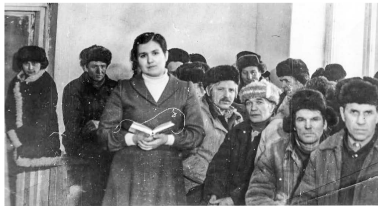
Многие предприятия города были партнерами библиотеки