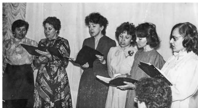
Библиотекари несли культуру в массы на литературных вечерах