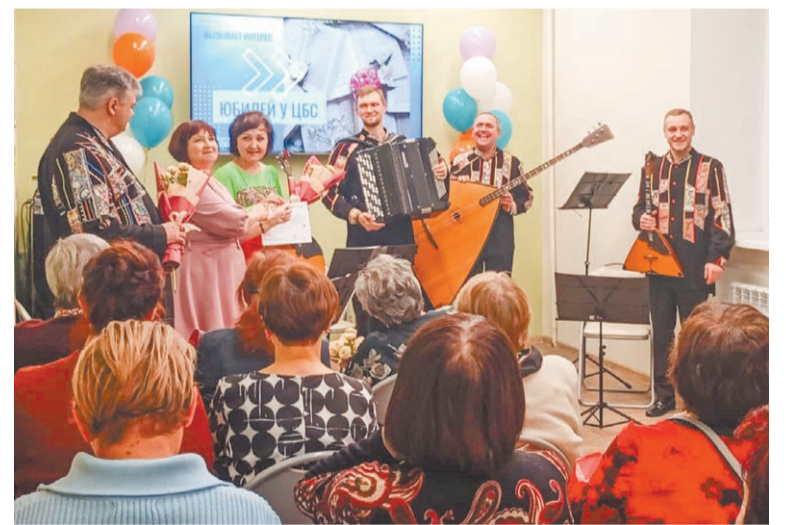
Юбиляров поздравили «Русичи»